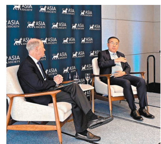
◆財庫局局長許正宇（右）上週六結束了訪美行程，其間介紹香港「ABC戰略定位」。

和金融市場的最新情況，並闡述香港的金融優勢和推廣香港的專業服務。此外，他亦向各界指出《維護國家安全條例草案》的通過有效維護國家安全，根本目標是更好地保障香港居民及在港其他人士的基本權利及自由，讓香港可以在安定的環境下全力推動經濟及金融發展。