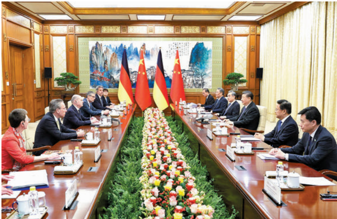
◆4月16日上午，國家主席習近平在北京釣魚台國賓館會見德國總理朔爾茨。

香港文匯報訊 據新華社報道，4月16日上午，國家主席習近平在北京釣魚台國賓館會見德國總理朔爾茨。習近平強調，中德之間沒有根本利益衝突，彼此不構成安全威脅。中德合作對雙方有利，對世界有利。世界越是動盪，雙方越要提升兩國關係的韌性和活力。