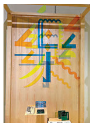
▲觀眾可利用文字部件模版創作專屬「繪系文字」。