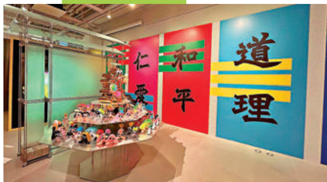
▲100位搪膠「人」物活現祠內善信參拜的眾生相。

LecceceToy更製作了100位搪膠「人」物，活現祠內善信參拜的眾生相；上有北魏真書自創諱字立體作品，化身「大人物」與大家見面，向大家作出美好祝願。北魏真書亦同時與設計工作室HATO聯手，以活潑的數碼互動裝置，讓大家跟着北魏真書的文字，以舞步跳走人間界，在GATE33藝文館內建構一個有趣的「文字空間」。