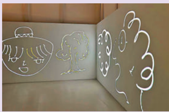
▲「見字生聲」創作出流動光影作品。

大家對九龍城的印象離不開「舊機場」「小泰國」「小潮州」等，時至今日，九龍城仍然是一個文化底蘊十分多元化的地區，不僅有地道的泰式美食，也將他們的語言、文字與香港文化糅合，慢慢流入歷史長河。