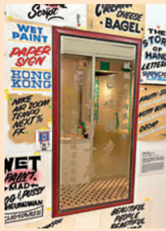
▲「贈字無限鏡房」反映土瓜灣和睦的鄰里關係。