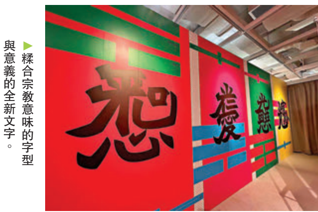
▲糅合宗教意味的字型與意義的全新文字。