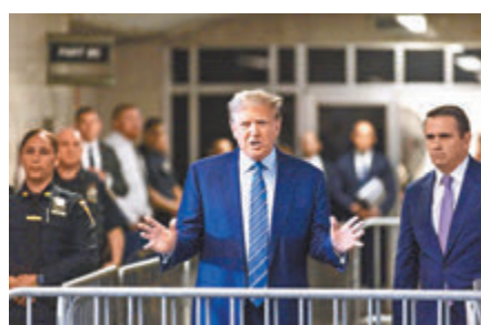
◆特朗普出庭前控訴「政治審判」。

法庭原定周一選出12名陪審員及6名候補人選，但96名入選陪審團名單的民眾中，逾半認為自己無法做到公平公正審理案件，未獲任命為陪審員。特朗普一方期望能選出一名俗稱「頑固陪審員」，在判決未能達成一致裁決時堅持其少數立場，讓裁決陷入僵局而迫使法官解散陪審團，從而拖長審訊時間。