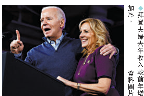
◆拜登夫婦去年收入較前年增7%。資料圖片