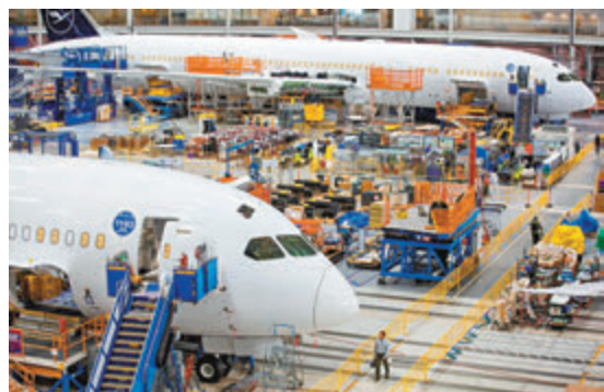
波音舉行記者會，表示787和777機型安全耐用。網上圖片

準，但有一小部分超過。齊澤姆則說，檢測並未發現零組件出現疲勞跡象，而在製造過程中提高施加力量並不成問題。