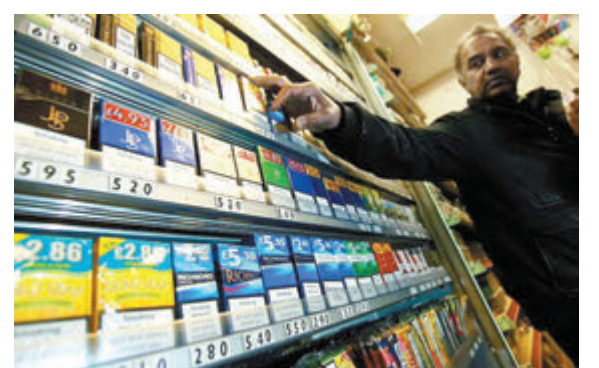
◆英國計劃禁止向2009年元旦後出世人士出售煙草產品。

《衛報》在投票前指出，首相蘇納克的盟友、下議院領袖莫當特對該法案態度猶豫不決，對於希望通過法案提振選情的蘇納克而言，莫當特的表態非常重要。