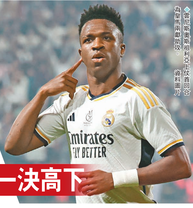
雲尼斯奧斯祖利亞上仗首回合為皇馬兩獻助攻。資料圖片