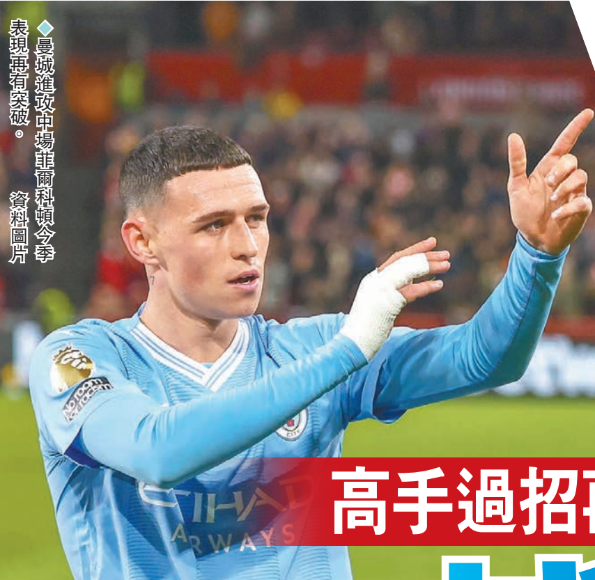
曼城進攻中場韋爾頓科頓今季表現更有突破。資料圖片