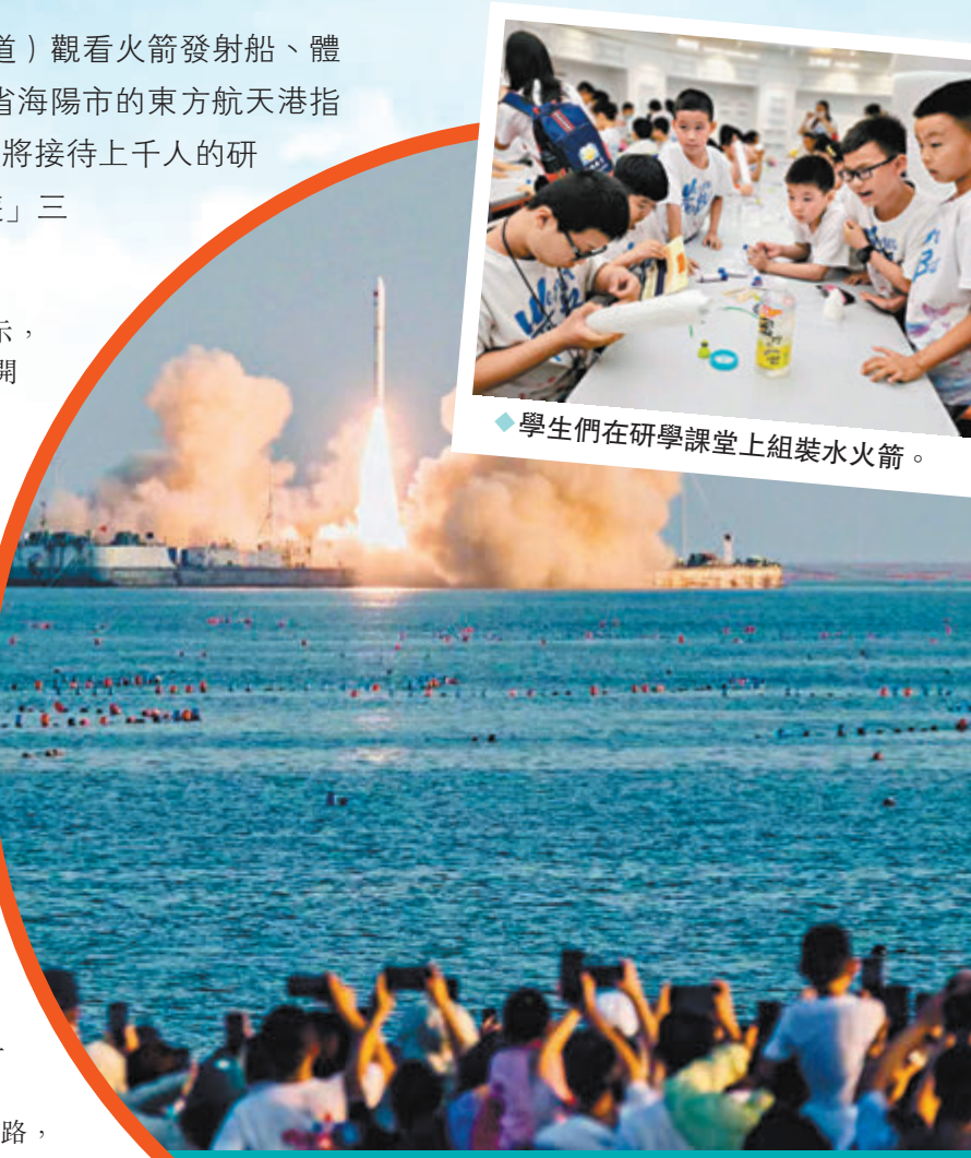
海上發射實現常態化後，研學的同學們可在岸邊觀看海上發射。圖為海上發射資料圖片。