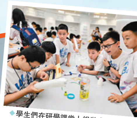
學生們在研學課堂上組裝水火箭。

新華社從中國載人航天工程辦公室獲悉，4月17日，神舟十八號載人飛船與長征二號F遙十八運載火箭組合體已轉運至發射區。目前，發射場設施設備狀態良好，後續將按計劃開展發射前的各項功能檢查、聯合測試等工作，計劃近日擇機實施發射。