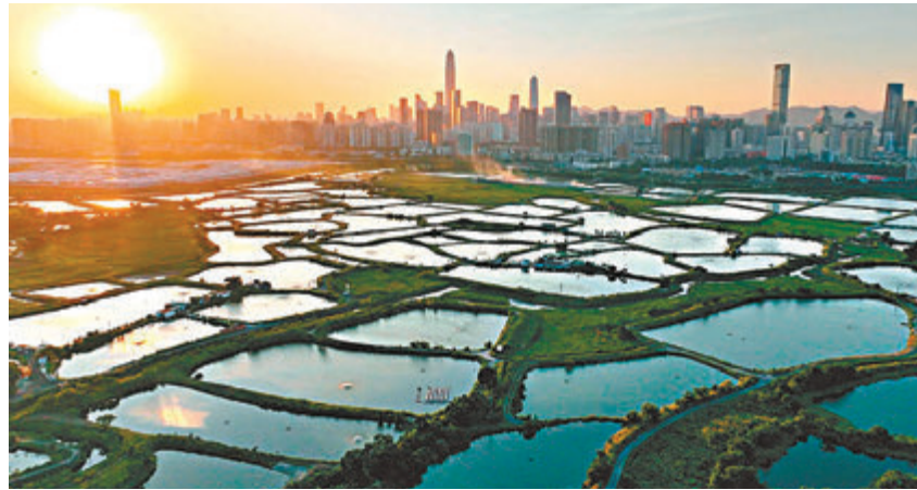
◆新田現貌資料圖片

就土拓署提交的新田/落馬洲發展樞紐環評報告批准的申請，環保署強調會嚴格按照《環評條例》的規定來審核，當中包括詳細研究相關環評報告，在全面和審慎考慮相關環評研究概要、《技術備忘錄》的要求、及於公眾查閱期間公眾和環諮會提出有關環境的意見後，才決定是否批准該環評報告；以及批准相關環評報告時應附設的條件。