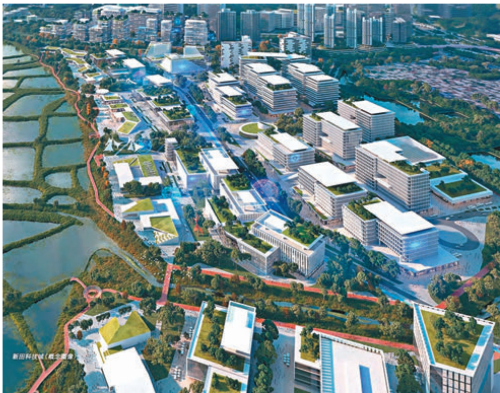
◆未來新田科技城模擬概念圖

有關工程項目對歐亞水獺的生態影響方面，雖然生態調查進行期間並沒有在項目的評估範圍內發現歐亞水獺，但環評報告已參考了近年相關的調查紀錄，包括於2018年和2019年在項目的評估範圍內曾發現有水獺糞便，因此生態評估亦已假設有歐亞水獺於項目評估範圍內出沒，並就工程項目對水獺產生的潛在影響作出了相應的評估，以及建議了相關的緩解措施。