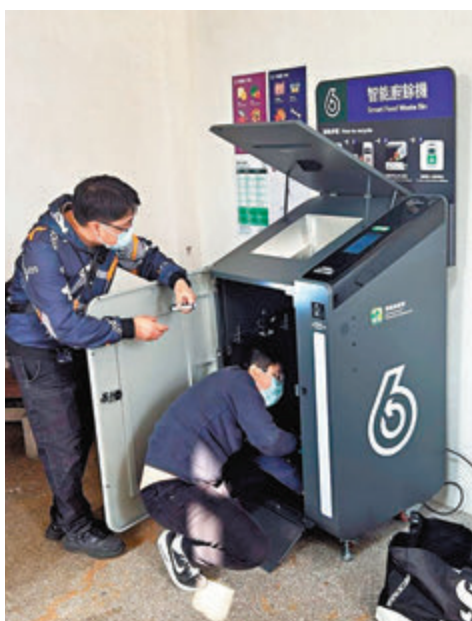
◆環保署已責成承辦商全面檢查維修，或更換廚餘機容易出問題的部件。

環保署表示，留意到廚餘機故障有三大原因，例如前門鎖配件損壞，導致前門無法關上；頂蓋疲勞下墜，導致居民缺乏足夠空間倒廚餘；以及訊號接收有時不穩定，令掃描二維碼時無反應。為改善廚餘機有效服務時間，環保署推行了加強措施，包括責成承辦商全面檢查維修或更換