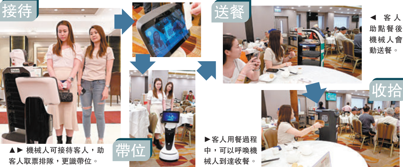
▲▶ 機械人可接待客人，助客人取票排隊，更識帶位。