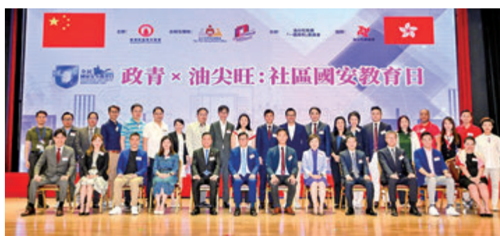
◆政青舉辦「政青x油尖旺：社區國安教育日」，保安局局長鄧炳強、教育局局長蔡若蓮、警務處處長蕭澤頤、中央政府駐港聯絡辦九龍工作部副部長李文彬等人士親臨支持。

鄧灝康表示，人才是發展的核心動力，過去一直為兩地青年人才交流融合鋪橋搭路，希望同心協力推動他們扎根灣區，背靠祖國，面向世界，實現更好的人生目標，為香港和國家發展作出更