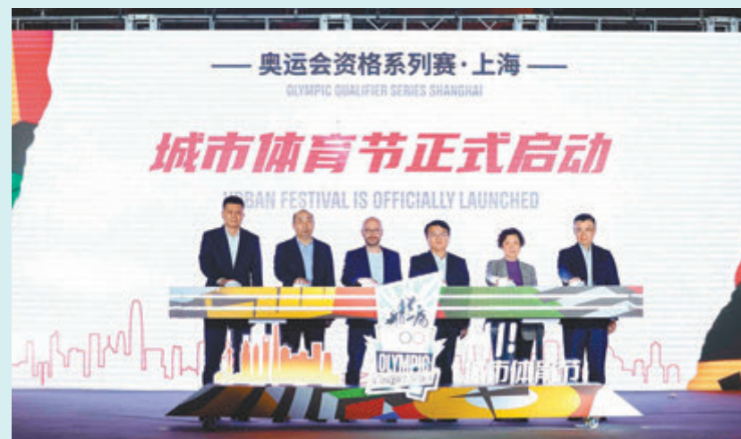
城市體育節正式啟動。

香港文匯報訊（記者 夏薇上海報導）奧運會資格系列賽日前迎來倒計時30天。16日晚間，賽事票務銷售全面啟動，城市體育節拉開序幕。國際奧委會奧運會部副部長巴迪表示，上海有着豐富的國際高水平賽事舉辦經驗，對於奧運會資格系列賽，上海的籌備非常有信心。