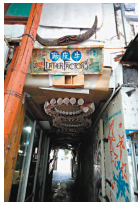
◆坪洲牛皮廠正門隱蔽地藏在道路一側。