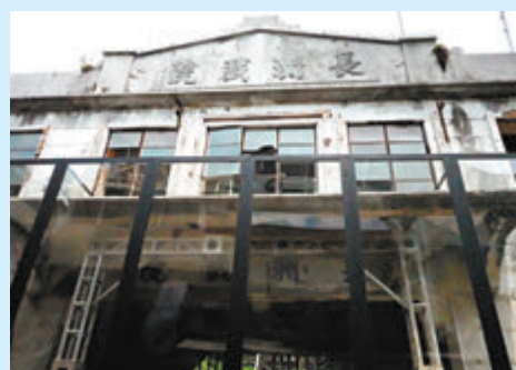
◆現被圍起的長洲戲院遺蹟。