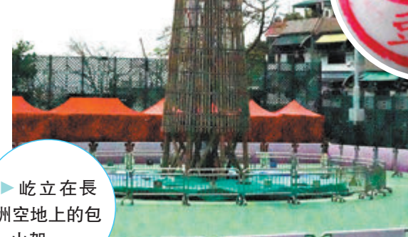
◆屹立在長洲空地上的包山架。