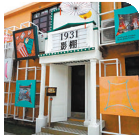
◆長洲戲院多元文化園區的1931影棚。