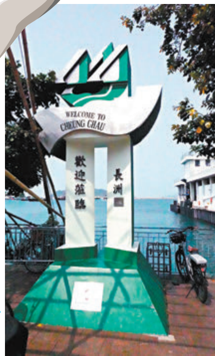
◆長洲碼頭的歡迎牌。