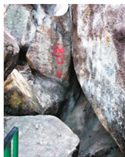
◆長洲位置隱秘的張保仔洞。