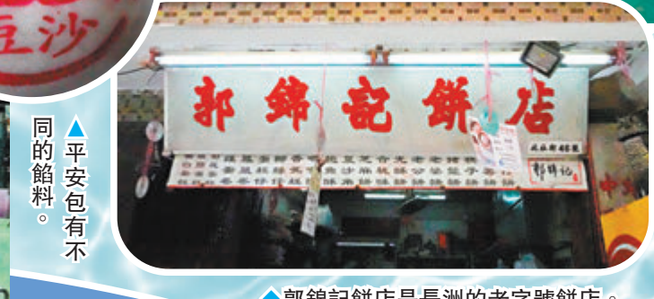
◆郭錦記餅店是長洲的老字號餅店。