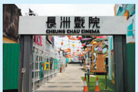
◆長洲戲院多元文化園區是長洲戲院及周邊區域活化後的產物。

立法會旅遊界議員姚柏良於日前接受香港文匯報記者訪問，針對離島旅遊資源的開發與現狀，以及完善各種設施的問題分享了他的構想與建議。他指出，除太平山、迪士尼樂園、海洋公園等眾多旅客「必去」的景點外，香港也需要開拓不同類型的、具有文化特色的景點。