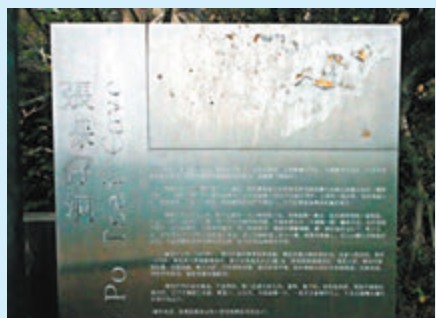
◆張保仔洞模糊不清的信息牌。