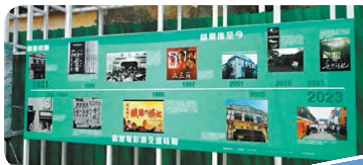
◆長洲戲院曾服務長洲居民逾60年。