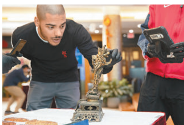
◆美方工作人員點交中國流失文物藝術品。

據了解，中美兩國於2009年1月14日首次簽署《中華人民共和國政府和美利堅合眾國政府對舊石器時代到唐末的歸類考古材料以及至少250年以上的古蹟雕塑和壁上藝術實施進口限制的諒解備忘錄》，之後分別於2014年和2019年續簽，2024年1月14日起第三次順延，有效期五年。據悉，截至2023年12月，中國已與包括美國在內的26個國家簽署了此類政府間文件。