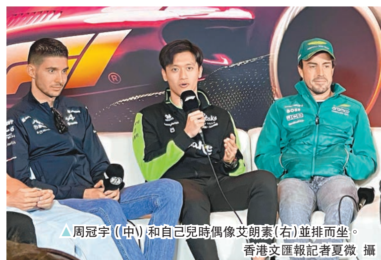
△周冠宇(中)和自己兒時偶像艾朗素(右)並排而坐。

不少人認為作為F1車手的周冠宇性格過於溫和， 對此，周冠宇道出了無奈卻又殘酷的現實，「我一 直沒有什麼機會去把自己表現出來。看到大家說 希望我能像角田這種性格，或者有什麼說什麼。 但如果我性格方面和他一樣，我不會走到F1賽 場。我只能止步在F2，這是一個非