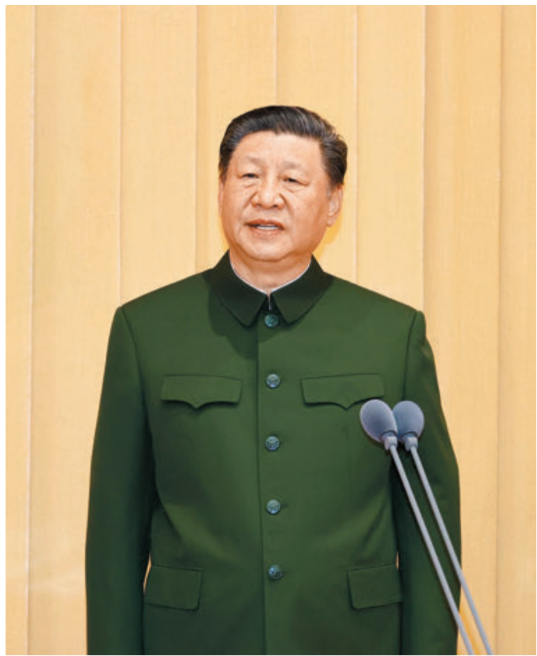
◆ 4月19日，中國人民解放軍信息支援部隊成立大會在北京八一大樓隆重舉行。中共中央總書記、國家主席、中央軍委主席習近平向信息支援部隊授予軍旗並致訓詞。這是習近平致訓詞。