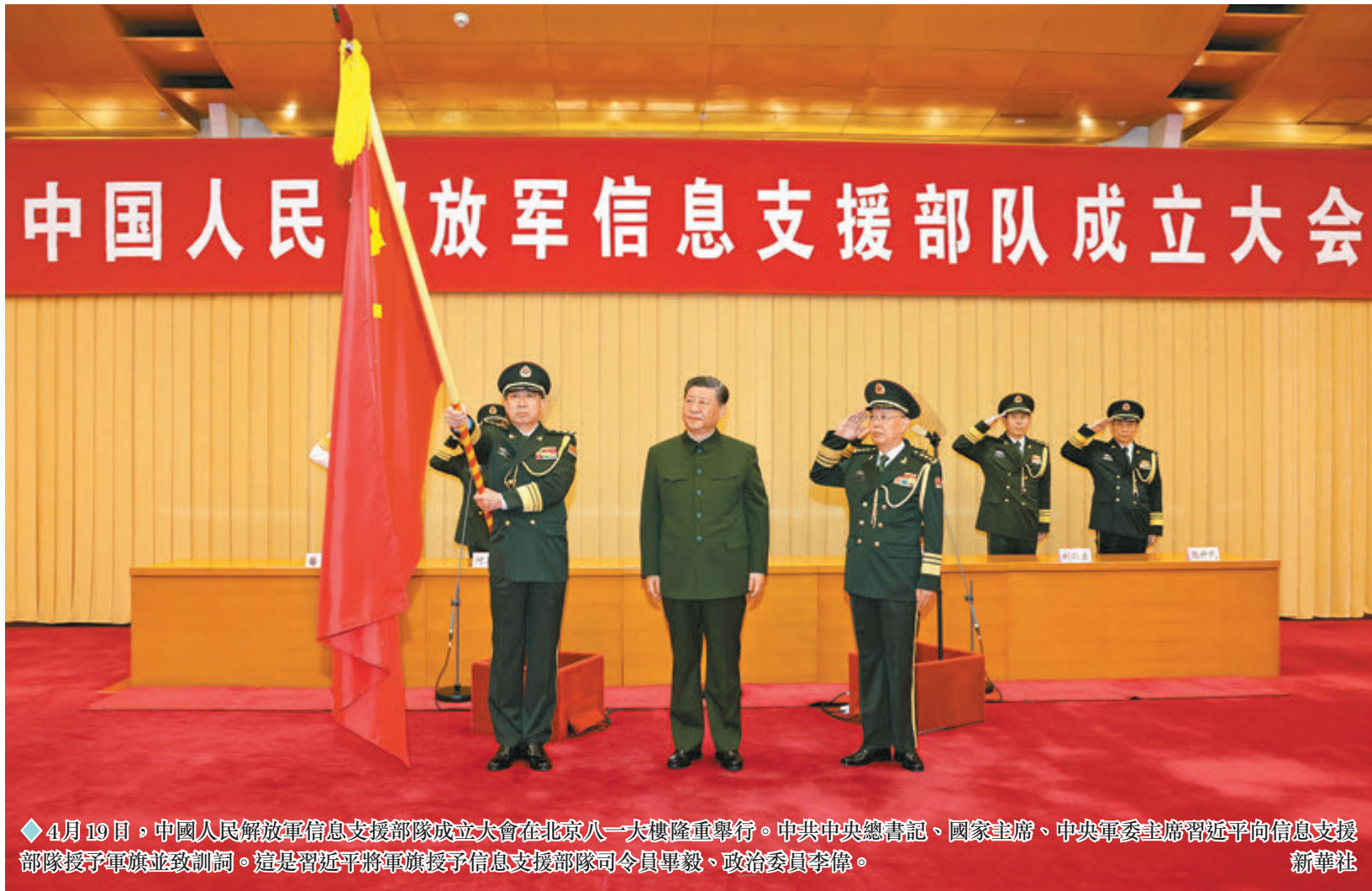
◆ 4月19日，中國人民解放軍信息支援部隊成立大會在北京八一大樓隆重舉行。中共中央總書記、國家主席、中央軍委主席習近平向信息支援部隊授予軍旗並致訓詞。這是習近平將軍旗授予信息支援部隊司令員畢毅、政治委員李偉。

香港文匯報訊 據新華社報道，中國人民解放軍信息支援部隊成立大會19日在北京八一大樓隆重舉行。中共中央總書記、國家主席、中央軍委主席習近平向信息支援部隊授予軍旗並致訓詞，代表黨中央和中央軍委向信息支援部隊全體官兵致以熱烈祝賀。習近平強調，信息支援部隊是全新打造的戰略性兵種，是統籌網絡信息體系建設運用的關鍵支撐，在推動我軍高質量發展和打贏現代戰爭中地位重要、責任重大。要加快創新發展，堅持作戰需求根本牽引，加強體系統籌，推進共建共享，強化科技創新，建設符合現代戰爭要求、具有我軍特色的網絡信息體系，高質量推動體系作戰能力加速提升。