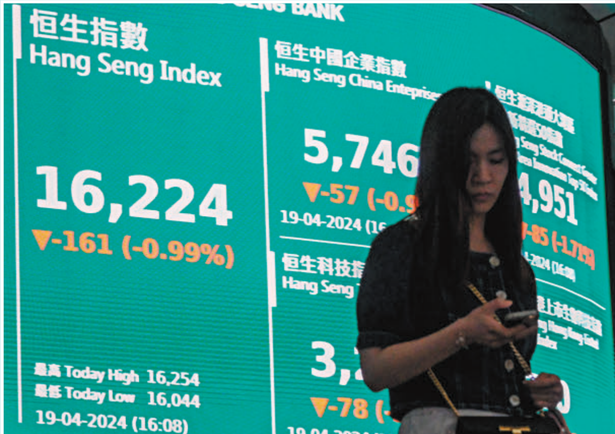
◆港股昨跌161點，成交1,061億元。全周計，恒指累跌497點。

中東局勢再呈現緊張狀態，港股繼續震盪行情發展。恒指昨低開139點，最多下挫341點見16,044點，收報16,224點，跌161點或1%；藍籌股普遍受壓，82隻藍籌58隻下跌。全周計，恒指累挫497點或3%，國企指數全周累跌2.3%，科技指數全周累挫5.7%。