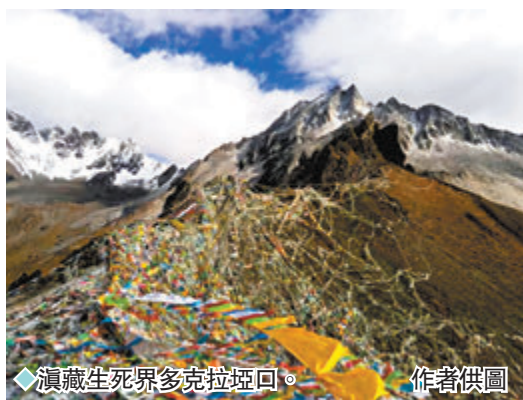
滇藏生死界多克拉山口。

可以看到雲霧繚繞的卡瓦格博峰的背面，還可以遠眺緬茨姆神女峰雍容華貴的峰姿，聆聽藏民們敬仰聖山的頌歌。