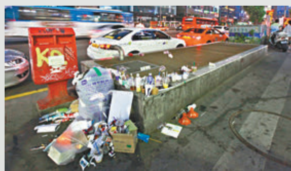
◆首爾街上垃圾桶數目減少，結果人們將垃圾丟在路邊。

香港文匯報訊 韓國自 1990 年代起推行垃圾分類系統，將家庭垃圾按照體積、重量和類別徵費。多個城市隨之削減街頭的垃圾桶數目，避免家庭或商舖為迴避徵費，利用公用垃圾桶丟棄付費垃圾。不過許多韓國民衆和海外遊客抱怨，垃圾桶數量減少間接影響生活便利，還令亂丟垃圾問題增加，影響市容。