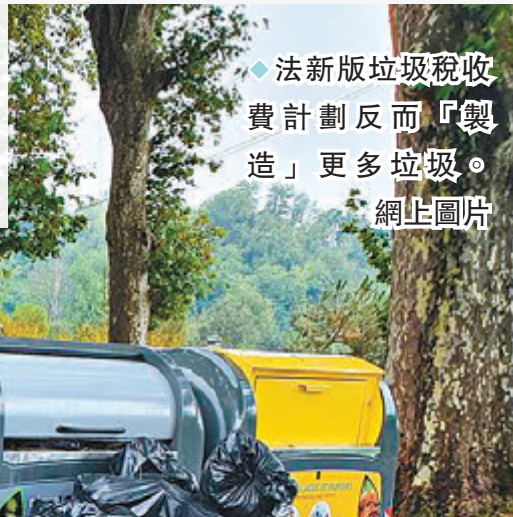
◆法新版垃圾稅收費計劃反而「製造」更多垃圾。

香港文匯報訊 全球多地近年不斷完善垃圾徵費計劃、吸取經驗教訓。法國近年推出新版垃圾稅收費計劃，將其分為「固定費用」和「可變費用」，理論上居民丟棄垃圾愈少、繳納費用也愈少。然而調查發現實施計劃反而「製造」更多垃圾，民衆隨地拋棄垃圾也不減反增。分析指民衆多不滿固定費用定價過高、垃圾分類方式過於複雜，當局缺乏違規懲罰措施，都成為推行計劃的挑戰。