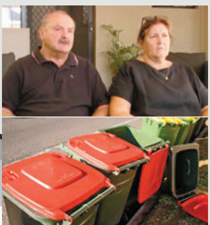
◆澳夫妻因兩個大尺寸紅蓋桶，繳了多年冤枉錢。 網上圖片