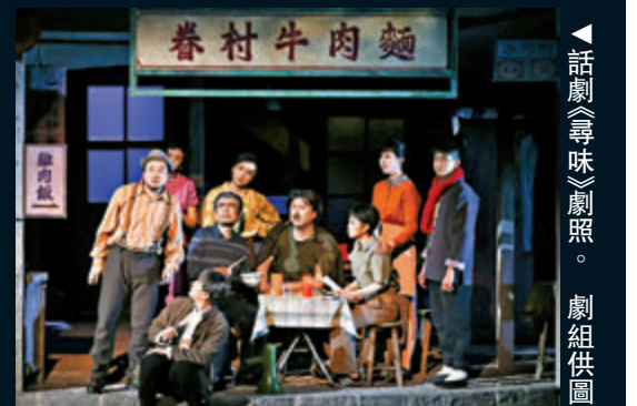
▲話劇《尋味》劇照。

據悉，在完成國家大劇院的演出後，《尋味》還將赴石家莊、西安、重慶、廣西等地巡演。