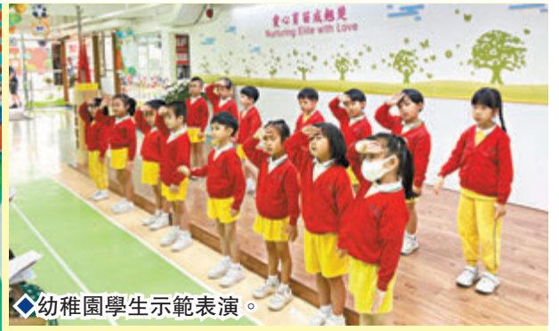
◆幼稚園學生示範表演。

三語 Tri-dialects 誦讀 Recitation 體能 Physique