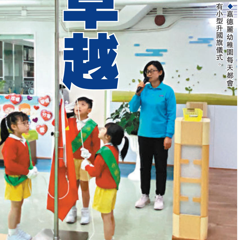
◆嘉德麗幼稚園每天都會有小型升旗儀式。