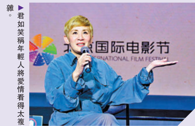
君如笑稱年輕人將愛情看得太複雜。