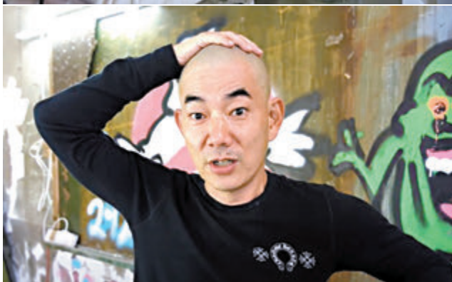
小齊解釋其實剃光頭是不想花時間去搞頭髮。

香港文匯報訊(記者 子棠)關心妍(Jade)昨日到新城廣播接受電台訪問。近年忙於巡演的Jade之前已完成了廣州、佛山、澳門的演出,下一站將會是6月的東莞站;Jade表示每次都選擇周末開騷,除為遷就觀眾第二日不用上班外,8歲的愛女心心亦因為不用上學,可以擔任表演嘉賓,其實女兒表演慾不強,不過就喜歡跟她湊熱鬧,笑言可能過兩年就不會理睬她(做嘉賓),所以會好好珍惜現在每一次親子檔的機會。