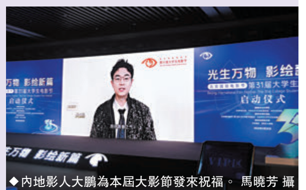
內地影人大鵬為本屆大影節發來祝福。