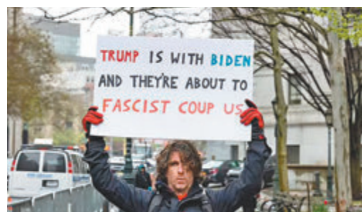
◆阿扎里洛日前手持標語示威，寫有「特朗普和拜登是同夥，他們準備發動法西斯政變。」