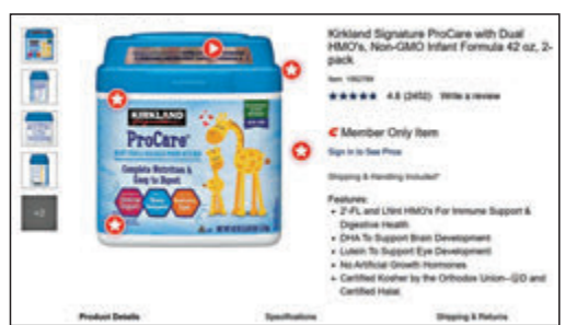
◆Costco 旗下嬰兒配方奶粉普及，限制會員訂購數量。