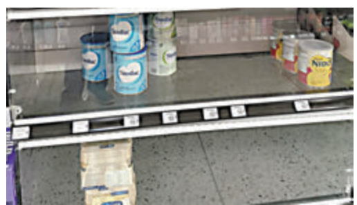
◆加拿大嬰兒配方奶粉供不應求，貨架常見缺貨。

香港文匯報訊(特約記者 成小智 多倫多報道)加拿大各地持續面對嬰兒配方奶粉供不應求，導致平均價格自2022年2月以來已上漲30%，令到很多基層家庭難以負擔，被迫勒緊褲頭減少日常開支來買奶粉。最近兩個月，中價配方奶粉經常在商店貨架上消失，家長唯有轉買名牌配方奶粉。