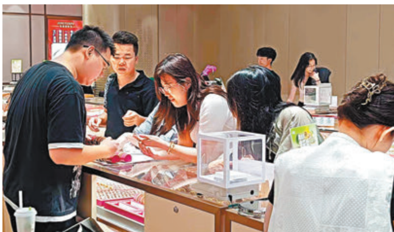
◆圖/文：香港文匯報記者 李昌鴻 深圳報道

受俄烏衝突、巴以衝突和美聯儲降息預期等因素影響，加上一些國家的央行不斷地增持黃金，國際金價近期像脫韁的野馬一路狂奔，4月12日倫敦金（現貨黃金）金價一度突破2,400美元的歷史高點。今年以來金價漲幅逾15%，超過去年全年水平。香港文匯報記者日前在深圳著名黃金珠寶交易中心羅湖水貝市場看到，周大福金飾價格已飆升至驚人的每克736元（人民幣，下同），有人更是以斤來買金條用於投資。有基金經理指出，短期黃金市場價格已由博弈情緒主導，與基本面指引有所偏離，潛在調整概率在加大，提醒投資者留意風險。