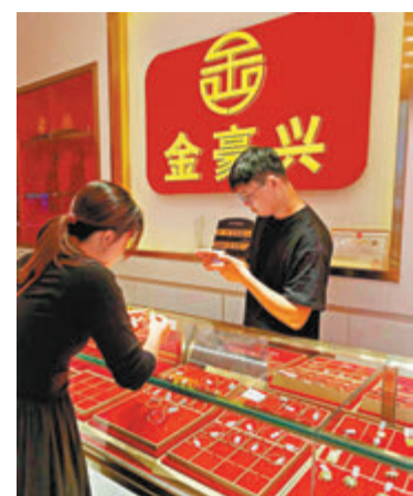
▲顧客在深圳羅湖水貝珠寶城的金行購買金條和金飾產品。