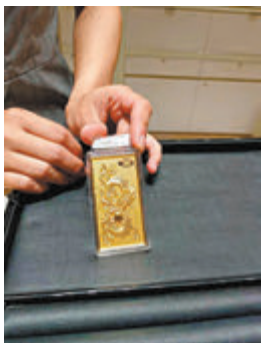
▲顧客前往水貝珠寶城購買金飾產品。