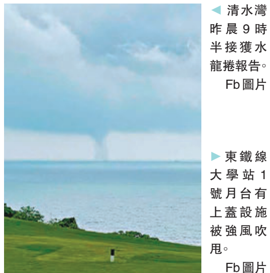
◆清水灣 昨晨9時半 接獲水龍捲報告。