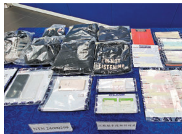
◆警揭破「彈票黨」檢獲的空頭支票、銀行入數紙及疑犯穿着的衣物等證物。