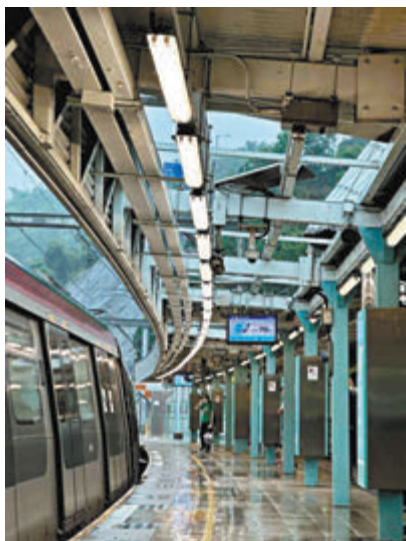
◆東鐵線 大學站1號 月台上有 上蓋設施 被強風吹 甩。