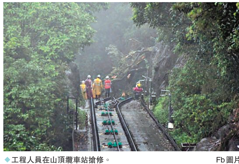
◆工程人員在山頂纜車站搶修。