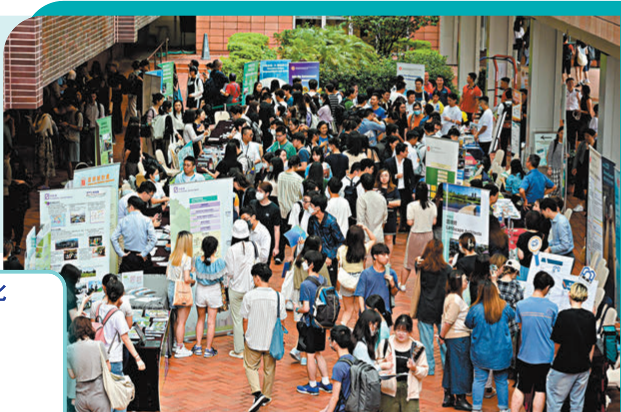
◆大學聯校就業資料庫 (JIJIS) 的最新數字顯示，今年首季向大學畢業生提供的全職空缺只有1.6萬多個，較去年同期少約三成。圖為企業及政府部門在大學提供招聘及應徵平台。

香港今年即將畢業踏入社會的大學生已開始四處求職。香港文匯報近日取得的大學聯校就業資料庫 (JIJIS) 的最新數字顯示，今年首季向大學畢業生提供的全職空缺只有1.6萬多個，不僅較去年同期少約三成，比起疫情前2019年同期亦減少約兩成。各行業工種空缺普遍呈減勢，逾十行業更較去年減少五成或以上，空缺數量下跌最多的是航空及運輸、銀行及金融等傳統行業，教育和工程等職缺數量亦有較大減幅。不過，醫療服務屬少數空缺增加的行業之一，較去年激增逾兩倍。專家建議求職大學生關注市場趨勢，調整求職策略，以及多參加職業相關輔導培訓，以增加競爭力 (見另稿)。 ◆香港文匯報記者 鍾健文