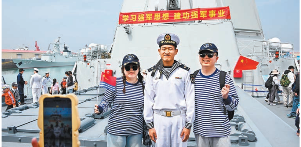
▲4月21日，觀眾在導彈驅逐艦貴陽艦上與海軍戰士合影留念。