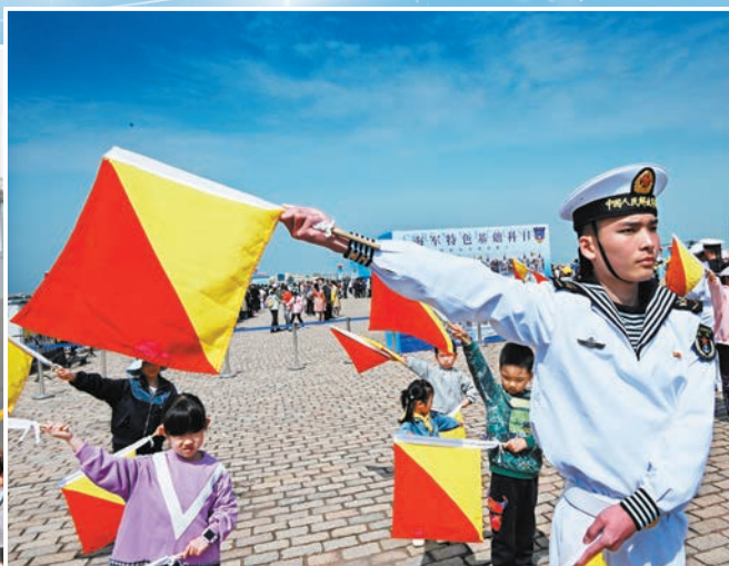
▲4月21日，青島港三號碼頭，小朋友在參加國際信號旗語體驗。新華社