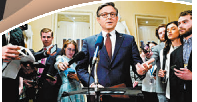
◆眾議長約翰遜在法案通過後發表講話。

使用條款指出用戶可隨時將其創建的AI語音刪除，防止他人盜用。但條款同時亦強調，用戶需要接受AI生成的聲音被他人使用，意味用戶或無法決定自己的聲音會說出什麼內容。