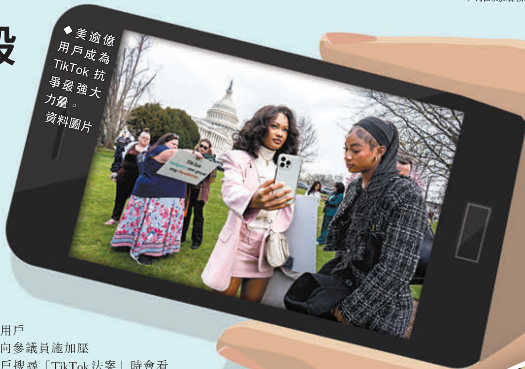
◆美逾億用戶成為TikTok抗爭最強大力量。

億計的用戶來幫助向參議員施加壓力。用戶搜尋「TikTok法案」時會看到一條橫幅，鼓勵他們「制止TikTok禁令」。點擊後會跳到一个頁面，用戶可輸入郵政編碼，以尋找並致電他們的參議員。