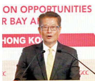
◆陳茂波表示對今年經濟有信心。

香港文匯報訊(記者 蔡競文)特區政府下月2日將公布第一季本地生產總值預估值數字，財政司司長陳茂波昨出席論壇時透露，首季本地經濟表現符合全年2.5%至3.5%的增長預期範圍，失業率都是在2.9%至3%左右，而今年首兩個月的基本通脹率不足1%。他表示對今年經濟發展有信心，今年訪港旅客、樓市及資金流入等方面，都見到改善，「香港仍是非常具活力，經濟環境、經濟氣氛都是相當好的，而且國家也大力支持我們。」