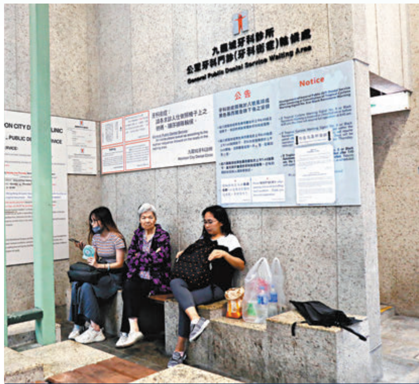
◆在九龍城牙科診所，身心疲憊的市民輪候籌號。

衛生署回應指派籌數目減少，是因新冠疫情爆發及人手不足，籌額自2020年1月起有所減少，署方採取多項積極措施以應對人手嚴重不足，包括全年進行牙科醫生的招聘，及以退休後服務合約和非公務員合約聘請牙醫。對於審計署的建議衛生署表示同意。