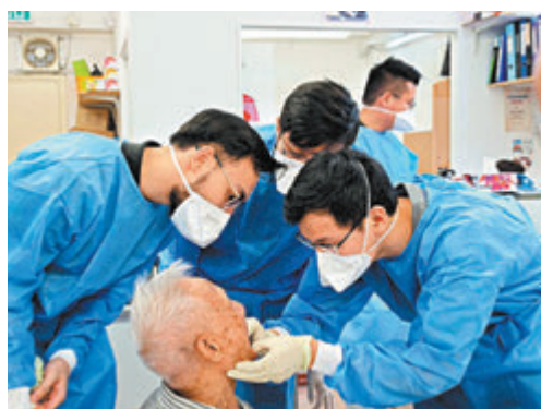
◆牙醫荒導致香港牙科服務嚴重供不應求。

安老院舍或長者日間護理中心的參與率亦不高，上年度截至去年12月整體參與率僅68%，當中三個非政府機構轄下安老院舍/長者日間護理中心的參與率連續三年或以上低於50%。關愛基金撥款為低收入長者提供免費鑲牙和相關牙科的服務，雖然參與率由2018年至2019