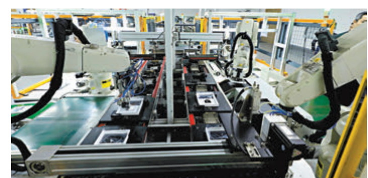
◆智能生產線投入後，NiRoTech產能增加1.5倍。

他並指，智能生產線令所需人手由38人縮減至11人，所需空間減少一半，產能卻增加1.5倍，「若以每名工人計算，產能更