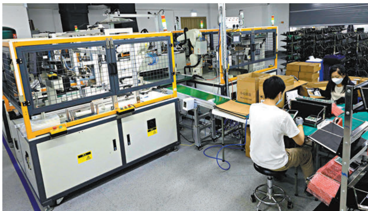
◆港企 NiRo Tech 在「投資研發現金回贈計劃」下，回港發展智能生產線，生產門禁系統產品。

他說，新型工業發展辦公室未來工作亦包括協助重點企業來港「落地」發展、支持本港傳統產業利用創科升級轉型，以及扶持初創企業「做大做强」；同時亦協助其他政府部門積極搶企業、搶人才，「目標是2027年內引進100間策略性企業。」此外，希望把新型工業資助計劃下的智能生產線由目前約30條增至2027年的130條。