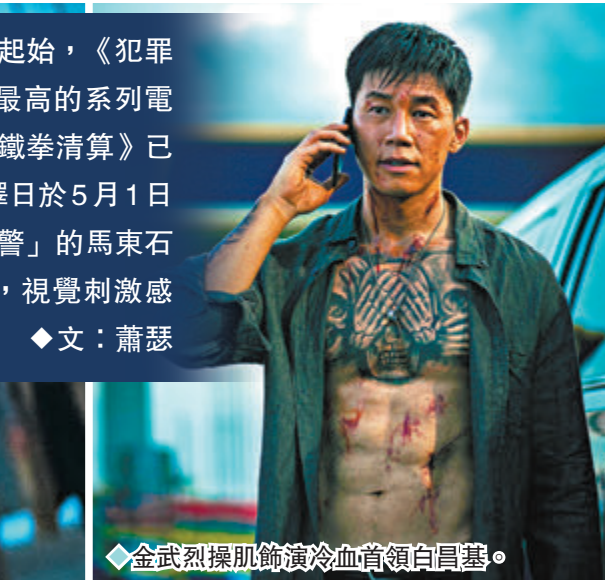
金武烈操肌飾演冷血首領白昌基。