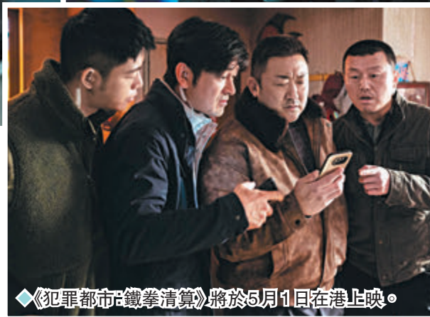
《犯罪都市：鐵拳清算》將於5月1日在港上映。

自從2017年的《犯罪都市》起，該系列成為韓國電影史上票房最高的系列電影，今次來到系列的第4集《犯罪都市：鐵拳清算》已於本月24日在韓國上映，香港緊貼其後擇日於5月1日上映！在《犯罪都市4》中飾演「怪物刑警」的馬東石對撼新反派金武烈，打鬥場面拳拳到肉，視覺刺激感十足，為觀眾送上痛快一拳！