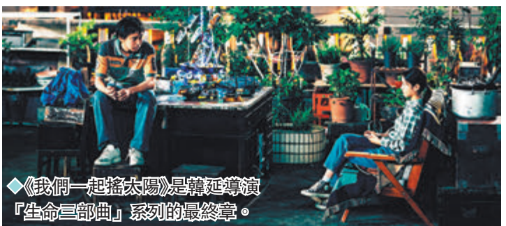
《我們一起搖太陽》是韓延導演「生命三部曲」系列的最終章。

由安樂影片有限公司送出《犯罪都市：鐵拳清算》電影換票證20張予香港《文匯報》讀者，有興趣的讀者們請剪下《星光透視》印花，連同貼上$2.2郵票兼註明索取「《犯罪都市：鐵拳清算》電影換票證」的回郵信封（填上個人電話），寄往香港仔田灣海旁道7號興偉中心3樓副刊部，便有機會得到換票證戲飛兩張。先到先得，送完即止。