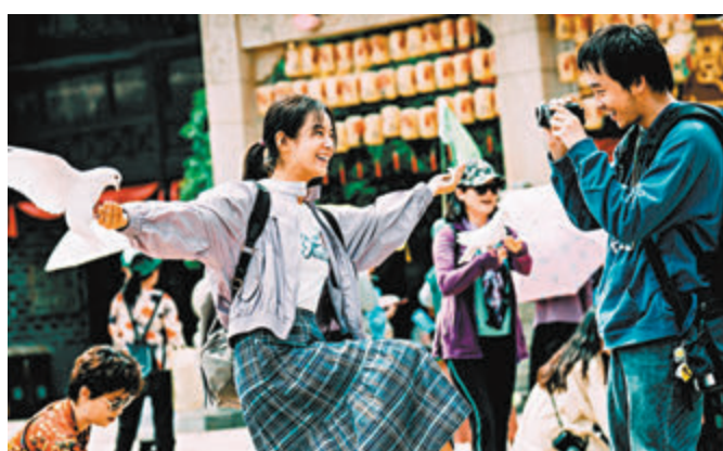
電影中呂途和凌敏是一對歡喜冤家，產生不少化學作用。