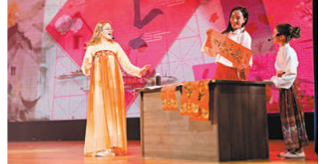
◆在俄羅斯首都莫斯科，學生們在中文日活動上表演節目。