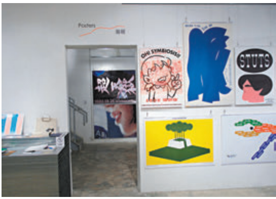
◆Graphic Design in Japan 2023 (Hong Kong Edition) 展覽現場。