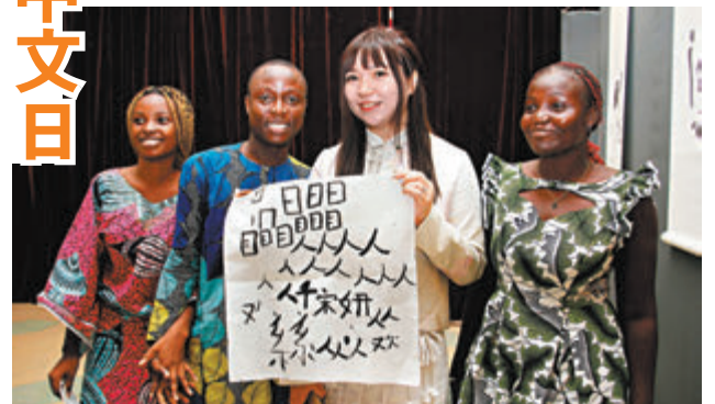
◆在貝寧科托努的貝寧中國文化中心，觀眾和中心工作人員在「畫意的書法」作品展上合影留念。

2010年，聯合國將中國傳統二十四節氣中的「穀雨」這一天定為「聯合國中文日」。過去15年來，中文日豐富多彩的活動因其宣傳中文在聯合國多邊外交工作中的作用，彰顯中國語言與文化的獨特魅力而備受矚目和期待。