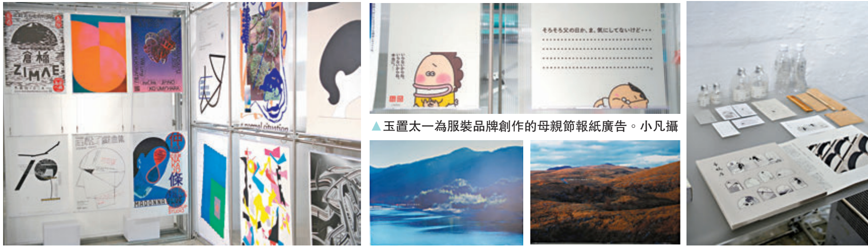
◆展覽中的獲獎海報