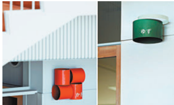
◆三澤遙作品「玉造幼稚園視覺與指標系統」。