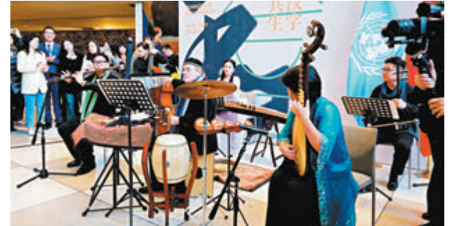
◆在紐約聯合國總部，藝術家們在「遇鑒漢字 和合共生」聯合國中文日慶祝活動現場演奏。