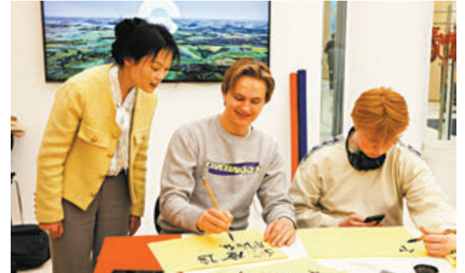
◆在挪威首都奧斯陸，當地民眾在中文日慶祝活動上體驗書法。