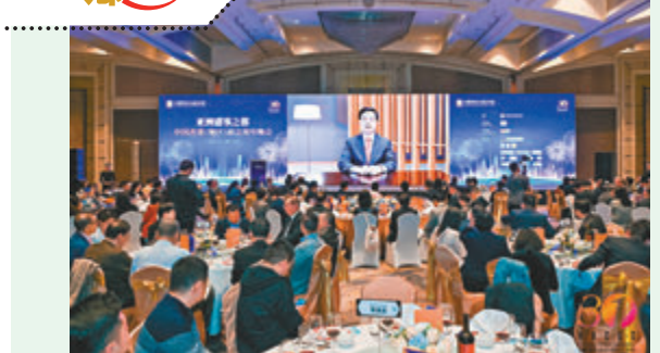
◆中國香港(地區)商會周年晚會，香港特區行政長官李家超先生視頻致辭。

在近期的創作旅程中，我得以藉助人工智能的神奇力量，孕育出幾首融合傳統與現代的國潮音樂視頻(MV—Music Video)。四月中旬，重返北京的我，雖一度被咳嗽所困擾，咽炎讓我暫時失聲，但經過幾日的休養生息，我便迫不及待地重新投入到AI創作中，繼續我的國潮MV創作之旅。