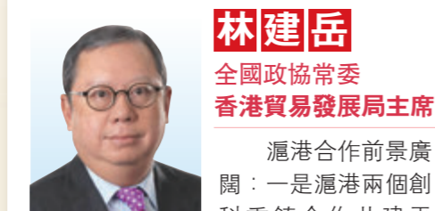
林建岳 全國政協常委 香港貿易發展局主席