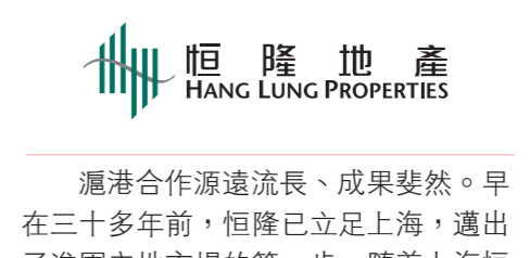
恒隆地產 HANG LUNG PROPERTIES