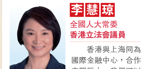
李慧琼 全國人大常委 香港立法會議員

巨人(含培育)企業累計超過2600家，雙載體孵化服務企業近3萬家，累計上市企業近200家。中國科學技術發展戰略研究院發布的《中國區域科技創新評價報告(2022)》中，上海綜合科技創新水平指數位列全國第一。