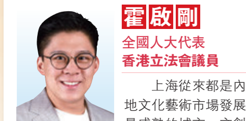
霍啟剛 全國人大代表 香港立法會議員