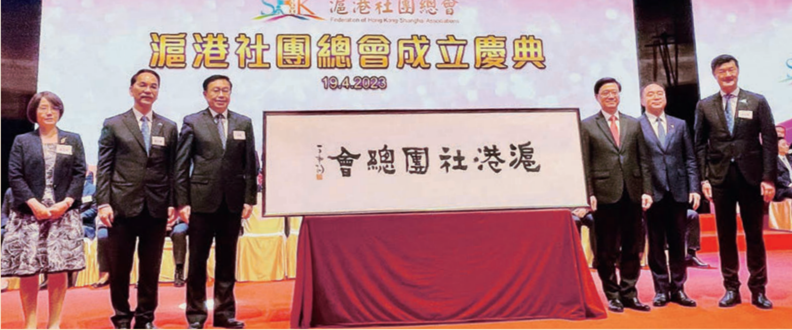
▲滬港社團總會成立慶典，在活動上舉行揭牌儀式。