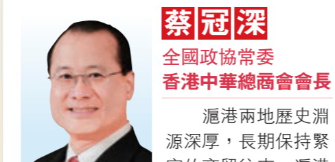
蔡冠深 全國政協常委 香港中華總商會會長