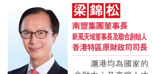
梁錦松 南豐集團董事長 新風天城董事長及聯合創始人 香港特區原財政司司長