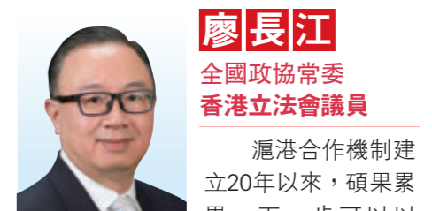
廖長江 全國政協常委 香港立法會議員