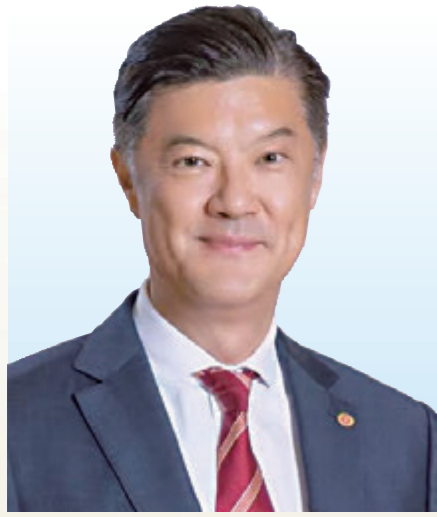
姚祖輝 全國人大代表 滬港社團總會主席