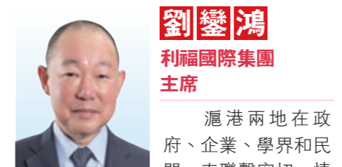
劉鑾鴻 利福國際集團主席