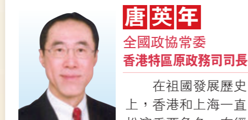
唐英年 全國政協常委 香港特區原政務司司長