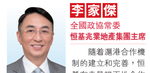
李家傑 全國政協常委 恒基兆業地產集團主席