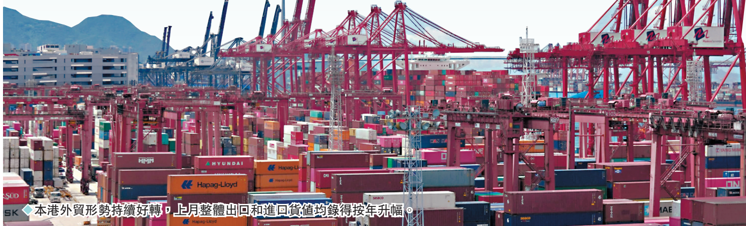
◆本港外貿形勢持續好轉，上月整體出口和進口貨值均錄得按年升幅。

口較2月改善，主要由於2月受農曆新年假期因素影響，首季經季節調整的整體出口按季增長5.7%，較去年第三、四季的1.8%和3%均有所加快，反映出處於復甦階段；進口數字亦顯示整體需求逐步改善。中線而言內地擴大內需及穩經濟措施對實體經濟的支持作用仍有待觀察，加上其他主要央行或未急於大幅減息，高利率環境或導致外圍經濟前景有下行壓力，而且歐美對內地製造業可能出現產能過剩的關注，均可能繼續為香港外貿表現帶來挑戰。該行估計本港今年全年出口或錄得單位數升幅。