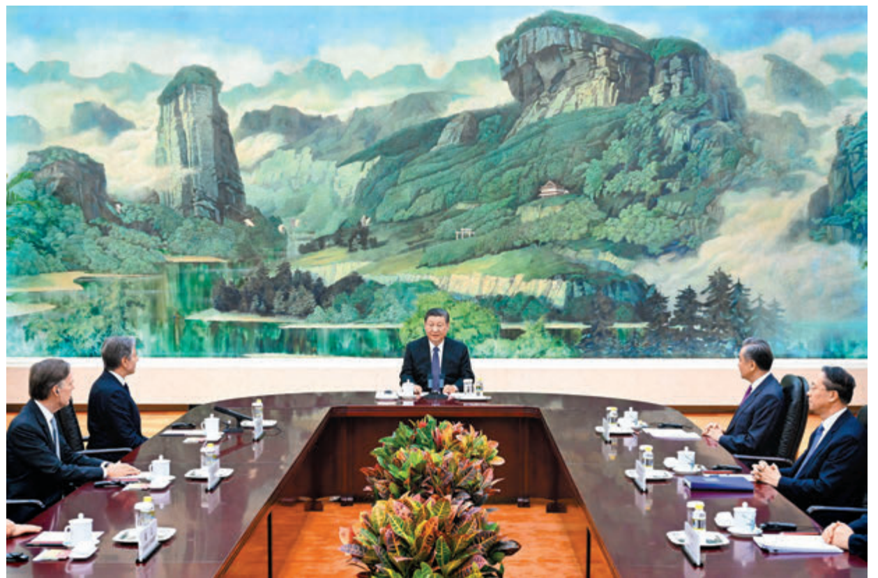
◆4月26日，國家主席習近平在北京人民大會堂與美國國務卿布林肯一行舉行會談。