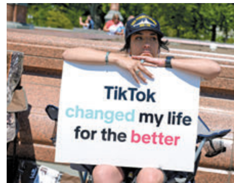
◆美國民眾在國會外抗議封殺令。