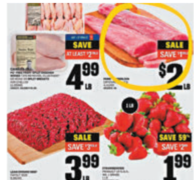
◆Loblaws本周推出的豬扒和玉米相對廉宜,但整體物價仍然偏高。