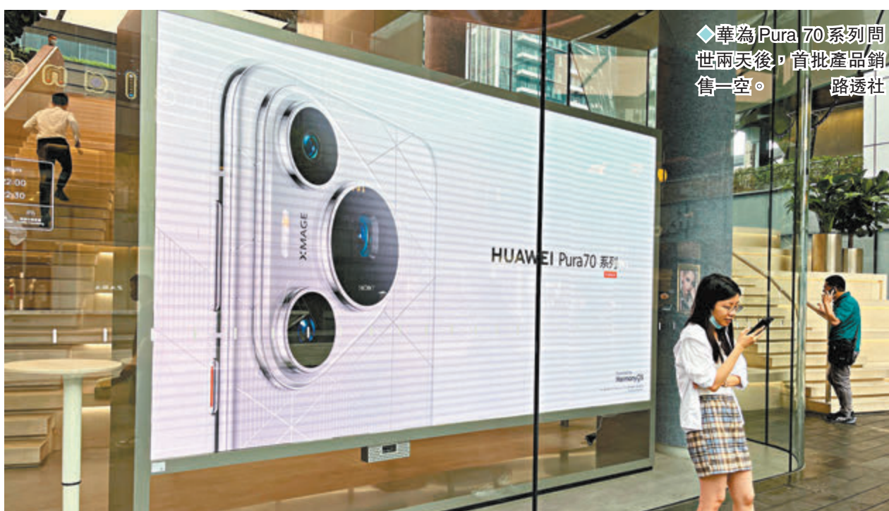
◆華為Pura 70系列問世兩天後,首批產品銷售一空。

彭博指出,華為與蘋果第一季度中國內地市場份額幾乎持平,凸顯華為在過去幾個月內,憑藉高性能5G智能手機蠶食了蘋果手機的市場份額。亦有傳媒分析,在全球經濟趨緩、華為手機業務保持強勢的情況下,iPhone手機在中國市場的受歡迎程度不及以前。