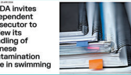
◆WADA在官方網頁公布邀請獨立檢察官審查中國運動員因污染致陽性事件。

WADA主席班卡說：「WADA的誠信與聲譽受到了傷害。在過去幾天，WADA遭到不公指責，認為我們偏向中國，沒有就此事向國際體育仲裁法庭提出上訴。我們拒絕這種虛假的指控，並願意將這一問題交到一名經驗豐富、受人尊重的獨立檢察官手中。感謝執委們在緊急通知下參加會議並給予支持。」