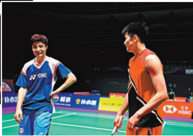
▼世界第二、國羽「一哥」石宇奇（左）狀態正佳。