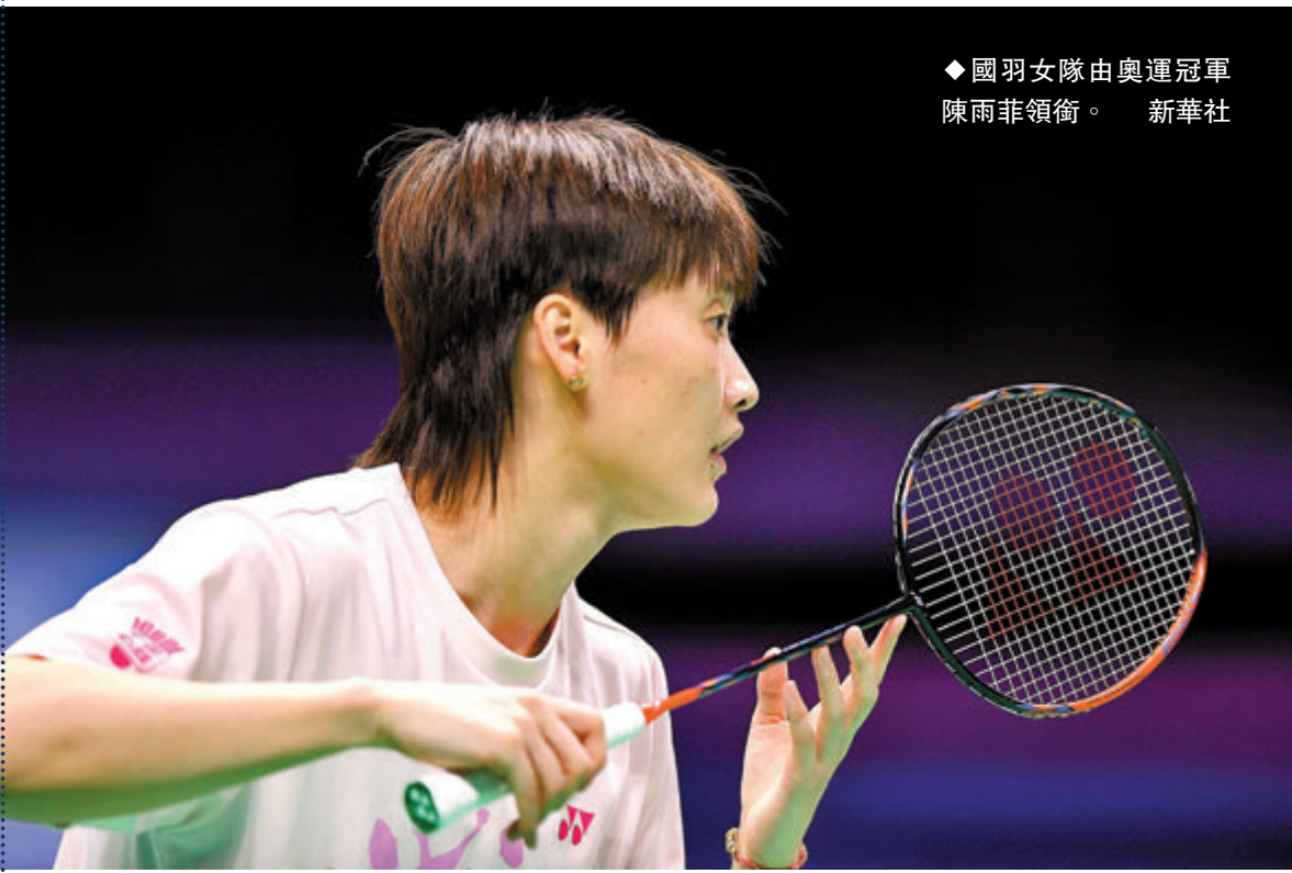
◆國羽女隊由奧運冠軍陳雨菲領銜。

中國隊自1982年首次參賽以來，曾奪得10次湯姆斯盃冠軍和15次優霸盃冠軍，是湯優盃歷史上最成功的隊伍之一。