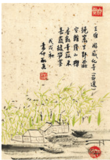
王維 遊感化寺（節選） 繞籬生野蕨，空館發山櫻。 香飯青菘菜，嘉蔬綠筍莖。

王維當日遊感化寺所見的山櫻，與今日的山櫻是否一樣？但肯定他所見的山櫻同是唐代詩人白居易所見一樣，白居易有詩詠山櫻：「亦知官舍非吾宅，且掘山櫻滿院栽。」山櫻每年一月至四月開花，是櫻花的一種。想不到唐代的櫻花竟在日本發揚光大，成為今時日本的代表。山櫻美麗，但只能觀賞，當年遊感化寺就如今天我們上大嶼山寶蓮寺，一定要吃一次齋宴的。且看王維在感化寺吃了什麼？野蕨，今日無法品嚐。菘米飯也沒有，大抵今日可吃的只有「嘉蔬綠筍莖」了。