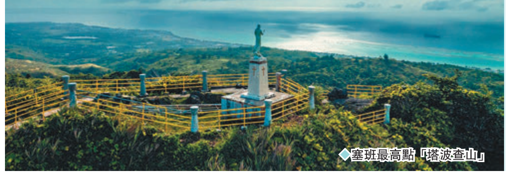
◆塞班島最高點「塔波查山」