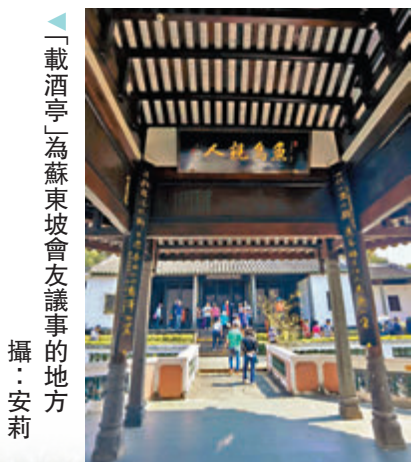
◆「載酒亭」為蘇東坡會友議事的地方