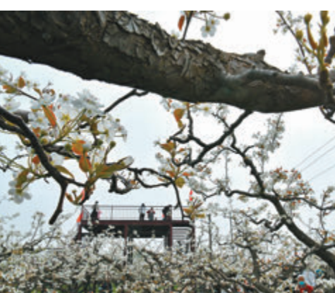
◆遊客在亞豐梨花觀光園內遊覽。

近年來，河北滄州泊頭市大力發展文旅產業，打造梨園文化旅遊品牌，吸引八方遊客前來踏春賞花。最近，泊頭市的25萬畝梨園迎來盛花期，不少遊客在亞豐梨花觀光園內遊覽，同時亦有市民在園內表演。