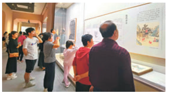
◆今年2月，「千古風流 不老東坡——蘇軾主題文物展」在海口開展以來，觀展人數已超30萬人次，大多為外地遊客。

清補涼其實是一種夏天清熱祛濕的老火湯，主要根據當地的氣候，生活習慣，採用的多是消暑降溫的原料，常見的有新鮮椰肉、綠豆、紅棗、西瓜粒、薏米等十幾種，再加入當地特產椰子汁，有下火消暑、清熱解毒、潤滑腸道等功能，甜而不膩，清涼可口。在海南炎熱的天氣裏，喝上一碗冰爽的清補涼實在是一件令人非常開心的事情。蘇東坡在品嚐過當地百姓製作的清補涼後極為稱嘆，當場盛讚：「椰樹上採瓊漿，捧來一碗白玉香」。傳說自此之後，蘇東坡在瓊期間每日必食一碗，讓清補涼聲名大噪。