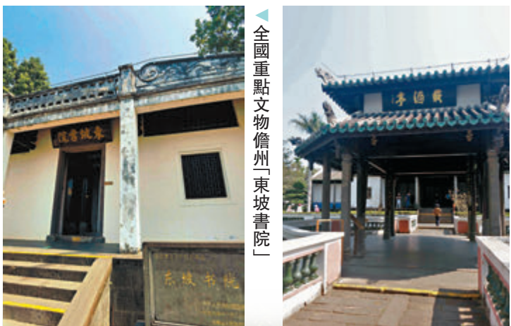
◆全國重點文物儋州「東坡書院」