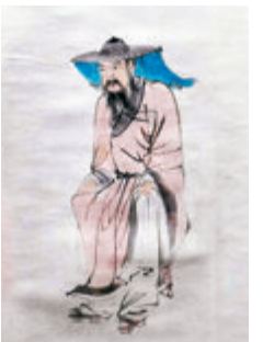
◆張大千臨摹自唐寅的《東坡笠履圖》

蘇東坡認為「漢黎一民」，「華夷同構」，具有樸素的民族平等意識，他學黎語，着黎裝，與黎族人民打成一片並建立了深厚友誼。生活雖然清苦，但蘇東坡卻得到了當地百姓對他的敬重與關心。有一天，蘇東坡去看望好友黎子雲，路過下雨，於是就近向農家借用了竹笠和木屐，他一穿戴起來，就顯得怪模怪樣，惹得婦女兒童相隨笑看，農家的狗也對着他亂吠一通。這讓蘇東坡也樂道：「笑者怪也吠者怪也」。由此可見蘇東坡性情隨和，與民眾關係非常和諧。他也留下了「我本海南民，寄生西蜀州」的深情詩句，流露出對這片土地的不捨之情。後來，人們便將蘇東坡所借戴的斗笠稱作「東坡笠」作為紀念，該「東坡笠」製作技藝已於2005年入選第一批海南省級非物質文化遺產名錄，東坡笠履形象也逐漸成為一個經典的繪畫題材。