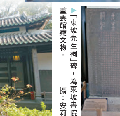
◆「東坡先生祠」碑，為東坡書院重要館藏文物。