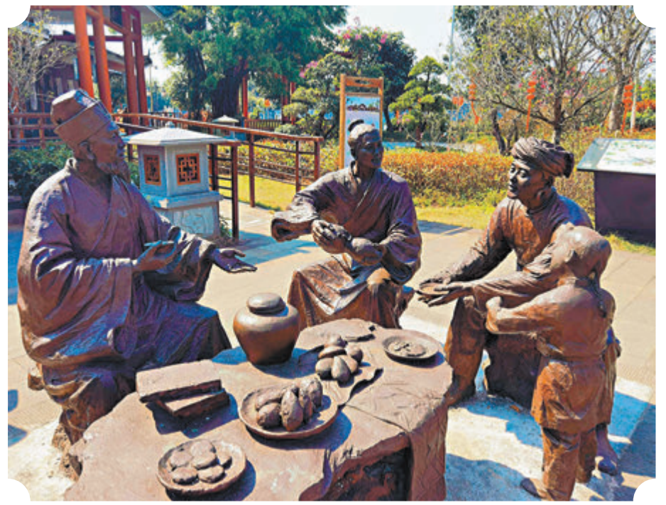
◆雕塑為蘇東坡（左一）與黎族人民在一起。

距海口1.5小時車程的「東坡書院」，始建於北宋紹聖五年（1098年），原名「載酒堂」，是蘇東坡居儋