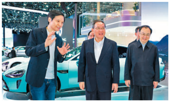
李強(中)4月28日在2024北京國際汽車展覽會調研。

香港文匯報訊 中共中央政治局常委、國務院總理李強4月28日在2024北京國際汽車展覽會調研。他強調，要深入落實習近平總書記關於推動汽車產業高質量發展的重要指示精神，大力發展