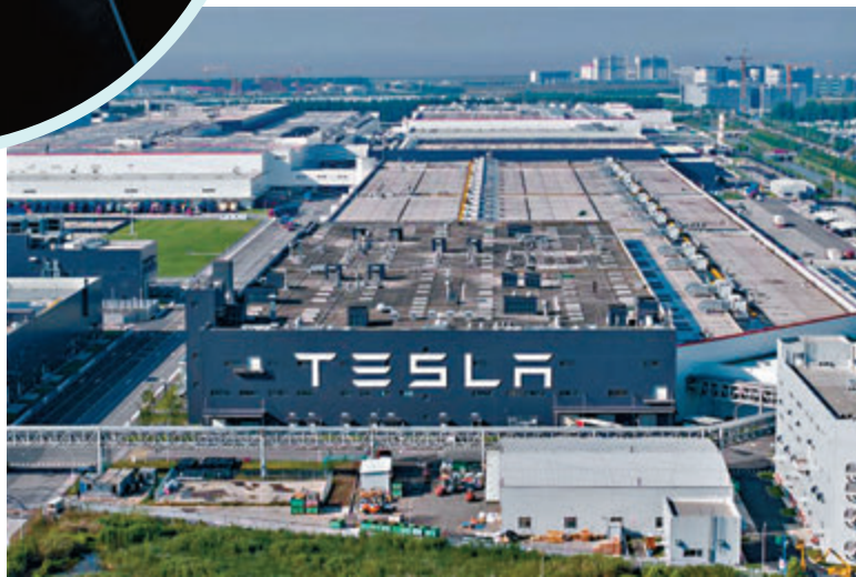
Tesla上海工廠生產車型符合中國安全要求。

此前，Tesla已於2021年Tesla上海數據中心，實現數據本地化存儲。此外，Tesla引入第三方權威機構對公司信息安全管理制度進行審核，並通過安全管理體系認證(ISO27001)。Tesla方面表示，各地對Tesla使用限制已陸續取消，包括Tesla在中國的製造中心城市上海。