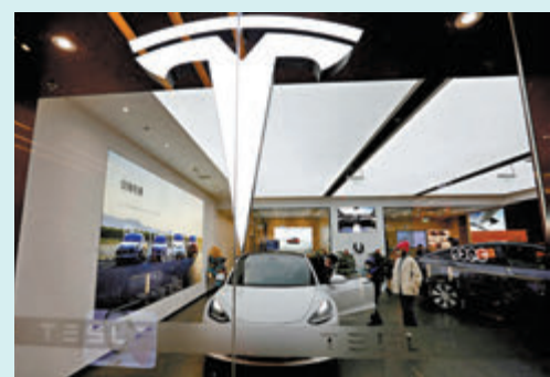
Tesla在中國4月的銷量料將顯著下降。

Tesla今年第一季銷量按年減少9%，為2020年疫情爆發以來首見，且是該公司第二次出現按年減少的表現。至於今年第二季，分析認為若Tesla希望達到華爾街預期的45.8萬輛，未來數周在作為Tesla第二大市場的中國，銷售需有所反彈，然而即使達成45.8萬輛的目標，仍較去年同期46.6萬銷量減少約2%。金融服務公司Robert W. Baird分析師卡洛也指出，Tesla本季交車量將按年減少4.6%，跌至約44.4萬輛。