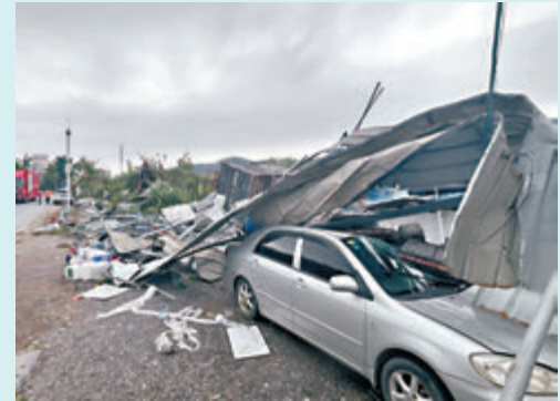
◆有小汽車嚴重受損，重型卡車亦被颳倒。