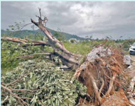
◆直徑超過1米的大樹被連根拔起。