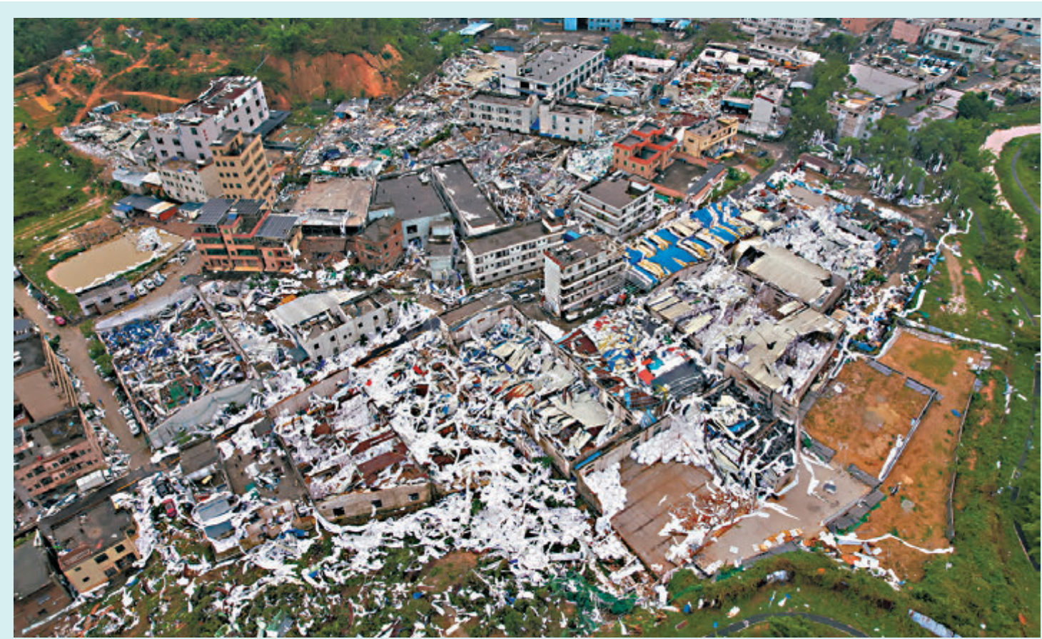
◆4月28日，廣州白雲區鍾落潭鎮突發強龍捲風，多個廠房屋頂被龍捲風掀翻，部分廠房夷為平地。

光明村片區的私人診所漢田診所工作人員說，27日至28日，先後有10多名在龍捲風中受傷的患者前來就診，還有一些頭部受傷較重以及腦震盪導致神志不清的患者，診所不敢接診，引導至周邊大的醫院。離漢田診所數百米遠的光明衛生站，27日接診了30多名傷者。