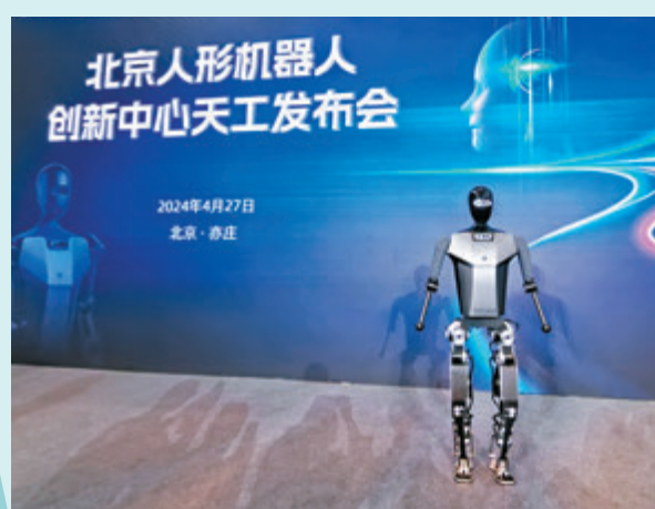
◆北京人形機器人创新中心27日發布自主研發的通用人形機器人母平台「天工」。「天工」是全球首創純電驅全尺寸人形機器人，擬人奔跑時速可達6公里。