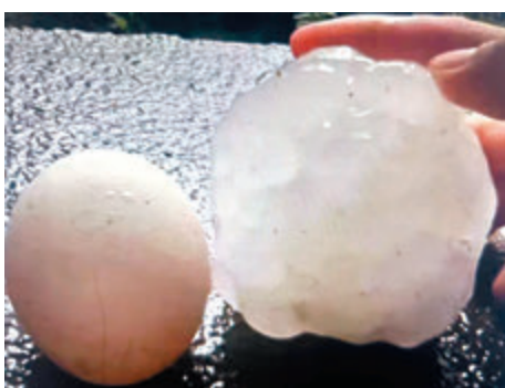
◆冰雹大小超過雞蛋如拳頭。 網上圖片

香港文匯報訊（記者 敖敏輝 廣州報道）在白雲區發生強龍捲風的同一時間，廣州增城、花都、番禺等地出現冰雹天氣，其中，增城區尤其嚴重，部分地區可見單個冰雹大過成人一個拳頭，不少居民受傷，房屋、農作物、汽車等損失慘重。