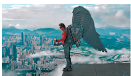
◆深圳城市形象片《敢為人先》截圖。

從圖紙轉化成實物，用了6個月的時間，不算螺絲五金和現成零件，光是單獨設計加工的零件就有700多個，用了5種不同的材質。在正式組裝前，團隊先進行了兩次試裝，邊裝邊調，優化細節。由於翅膀設計結構複雜，使用零件多，單是一次組裝或拆卸，就要用48小時。