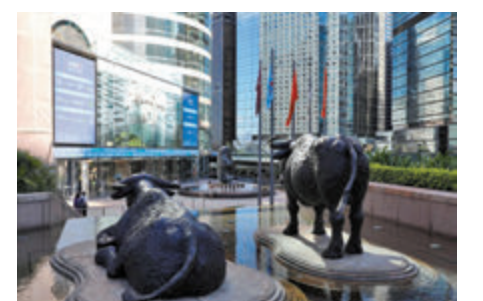
◆互聯互通再擴容下，目前納入港股通的香港ETF增至10家。

恒指公司目前管理超過2,200項指數，截至3月31日，全球共有115隻與恒生指數系列掛鈎的交易所買賣產品，被動式追蹤恒生指數系列產品的資產管理總值約655億美元。截至該日，ETF通的全數8隻南向合資格ETF皆為追蹤恒生指數系列的指數，資產管理總值約1,937億港元。