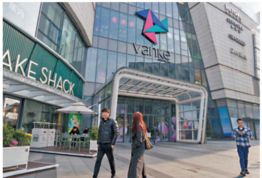
◆萬科A等地產股掀漲停潮，A股房地產開發板塊升逾6%。圖為萬科在內地的商場。

房地產產業鏈昨迎來久違的大漲，其中房地產服務板塊漲8%，特發服務價格升20%，榮