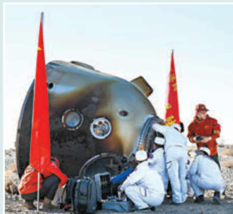
◆現場醫監醫保人員確認航天员湯洪波、唐勝傑、江新林身體狀態良好，神十七載人飛行任務取得圓滿成功。