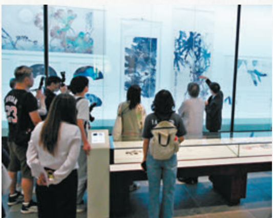
◆觀展者聚精會神觀賞展品。

他相信，香港並不缺乏美景，無論是山巒或海岸，風光都可比肩世界名勝景點，值得更多藝術上的發掘和創作。