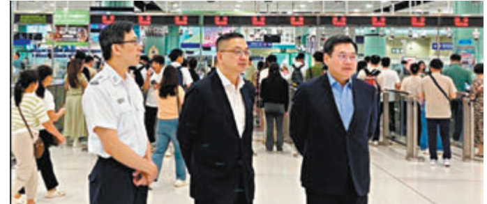
◆入境處處長郭俊峯與入境處處長助理處長樊曉聲昨晨先後到羅湖西九龍站、落馬洲支線及羅湖管制站巡視。

在羅湖口岸，昨晨有不少旅客拖着行李過關來港。郭俊峯表示，羅湖口岸上午秩序大致良好，截至昨晨10時，有4.3萬人次內地旅客入境香港，較平日增加，處方已增加人手及加開櫃位在各口岸協助，相信足夠應付增加的人流，