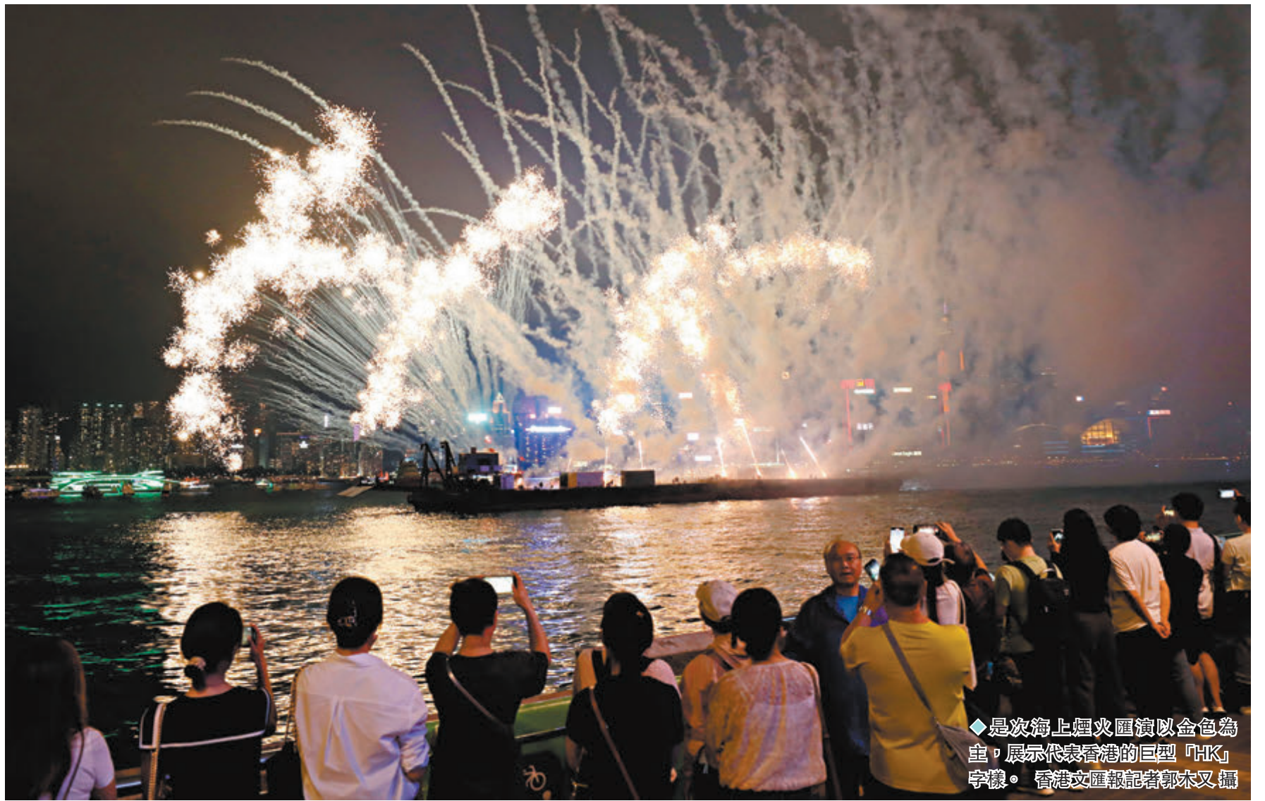
◆是次海上煙火匯演以金色為主，展示代表香港的巨型「HK」字樣。

維港附近餐廳為吸引顧客，推出特別調酒、五一餐單和表演等。餐廳老闆表示，生意比平時增加兩至三成。亦有餐廳向旅客派發飲品券，有來自英國的旅客說氣氛很好，特意預約維港兩岸的餐廳，期望觀賞煙火表演，又對派發飲品券感到驚喜。