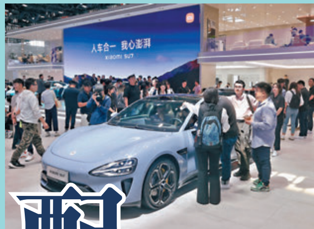
◆小米SU7截至上月已收到88,063份確認訂單。