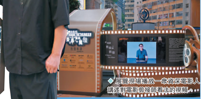
◆展覽現場播放一眾資深電影人講述對電影剪接師看法的視頻。