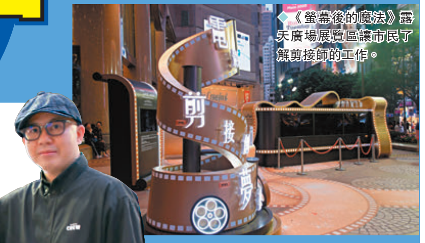
◆《螢幕後的魔法》露天廣場展覽區讓市民了解剪接師的工作。