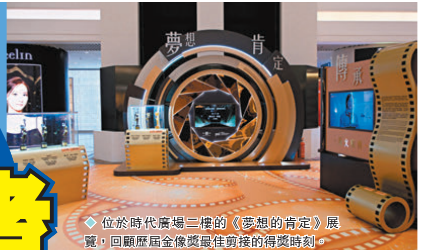
◆位於時代廣場三樓的《夢想的肯定》展覽，回顧歷屆金像獎最佳剪接的得獎時刻。