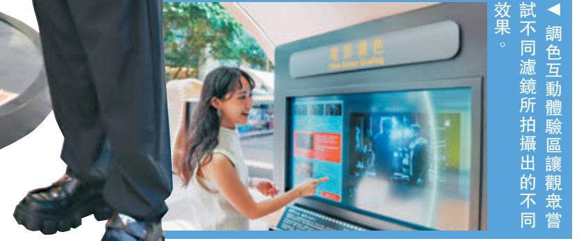
◆調色互動體驗區讓觀眾嘗試不同濾鏡所拍攝出的不同效果。