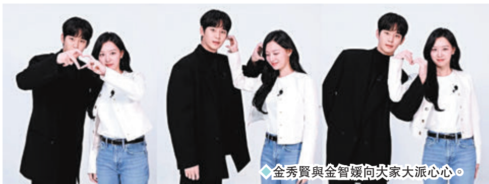
◆金秀賢與金智媛向大家大派心心。