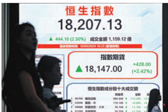
◆港股連升8日，重上萬八大關。

科技股再度回勇，科指全日挾升4.5%，收報3,865點，亦收復250天線(3,778點)。ATM三股中，美團(3690)再被挾升，收報119.1元，升8.8%。AI股商湯(0020)更爆升36%，收報1.66元，是升幅最大科指成份股。電動車股也是市場焦點，各大電動車股公布4月份數據，交付量同比升逾1倍的蔚來(9866)，被炒高20.7%，表現最突出。遇上內地五一長假，加上澳門4月博彩收入高過市場預期，濠賭股全線向好，新濠(0200)升7.3%，美高梅(2282)升4.8%，金沙(1928)升3.3%。