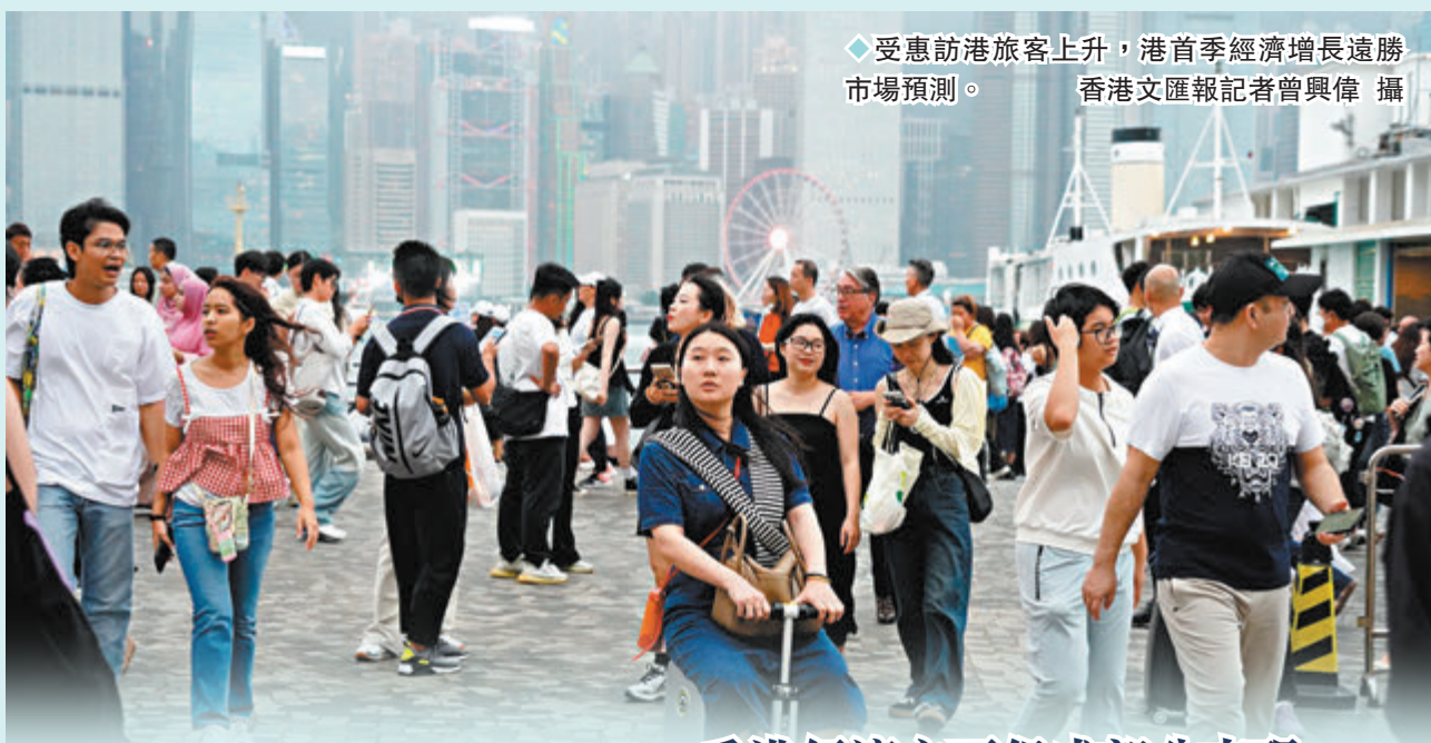
◆受惠訪港旅客上升，港首季經濟增長遠勝市場預測。

香港國安法實施及早前隨着國安條例立法，香港社會穩定發展，讓特區政府全力拚經濟，積極招商引才、大辦盛事，相關成效在今年首季繼續顯現。受惠訪港旅客進一步上升，及整體服務輸出顯著增長，香港今年首季經濟增長預估按年上升2.7%，勝過市場0.8%的增長預測，也符合特區政府2.5%至3.5%的全年增長預測範圍。分析指出，近期資產市場氣氛好轉，及勞工市場穩健，有助本地消費信心進一步改善，料本港今年全年經濟增長約2.8%。