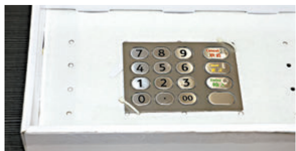
◆未有市民曾經將提款卡或信用卡插入有關讀卡裝置。

香港文匯報訊（記者 蕭景源）警方於今年4月初在旺角公眾地方安裝的防罪滅罪閉路電視，助警方再破第三宗案件。有不法分子在銀行自動存款機偷裝讀卡器和假鍵盤，企圖盜取市民銀行資料。警方在接獲銀行報案後，通過新安裝的防罪「天眼」，迅速鎖定兩名疑犯及逃走路線，本周二拘捕其中一名男子，並暫控一項「有犯罪或不誠實意圖而取用電腦」罪，昨日在西九龍裁判法院提堂。