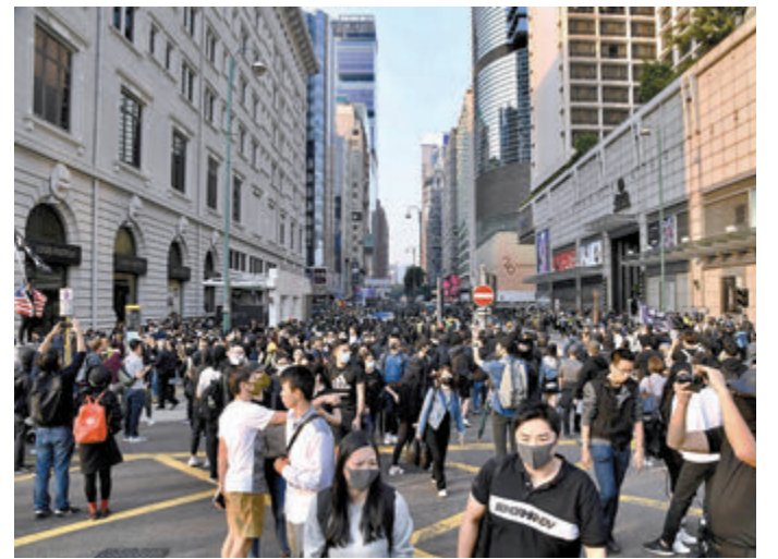
▲「屠龍小隊」一度計劃於2019年12月1日藉尖沙咀示威遊行，在尖沙咀警署外放炸彈。圖為示威者當日非法佔據梳士巴利道。