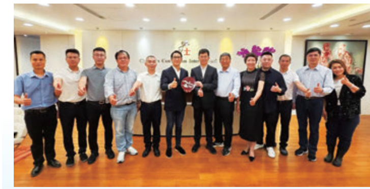
◆圖為活動現場大合照。