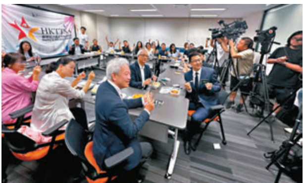
◆香港高才通人才服務協會昨日舉行「高才餐廳打卡會·自帶餐具我先行」活動。

他建議將「先行先試」計劃擴大至鄉郊、學校等試行，但不認同擱置徵費，建議可以考慮分階段落實。