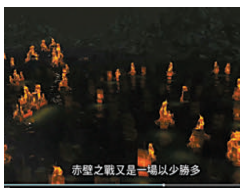
◆赤壁之戰短視頻。教材套影片選段截圖

與之相關的教學指引建議，課堂的內容重點可分為赤壁之戰前天下三分大勢、赤壁之戰的主要經過及三國鼎立的形成。流程上，教師可先帶領學生重溫東漢末年官渡之戰後，曹操鞏固北方勢力，揮軍南下希望奪取天下，然後概述曹操親率大軍要