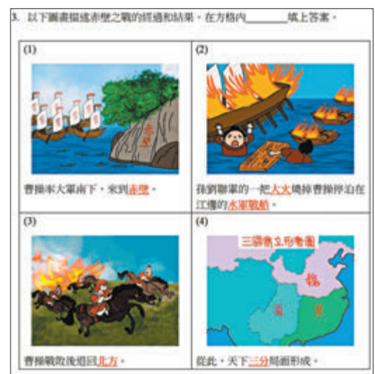
◆赤壁之戰相關工作紙題目。教材套教學指引截圖

教學指引又就該段歷史作出課堂總結和提供多項資料補充，例如記述赤壁之戰的文學作品，包括宋代蘇軾的《赤壁懷古》，晉代陳壽編寫的正史《三國志》，以及在元末明初由羅貫中所著的長篇歷史演義章回小說《三國演義》，以豐富和充實學生的歷史視野。